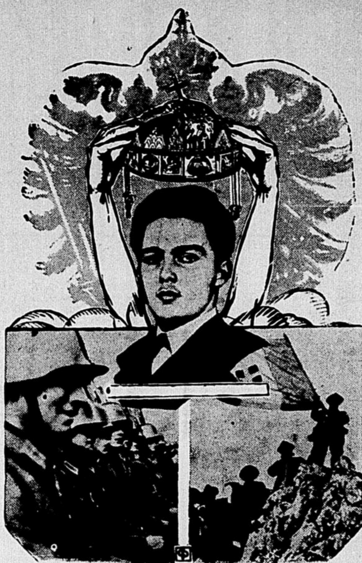
L'archiduc Otto, dont on annonce, avec restrictions, la restauration sur le trône d'Autriche. En bas (à gauche) un groupe de nazis allemands, qui verraient telle restauration d'un mauvais oeil; (à droite) groupe de fascistes italiens, qui la verraient d'un bon oeil.