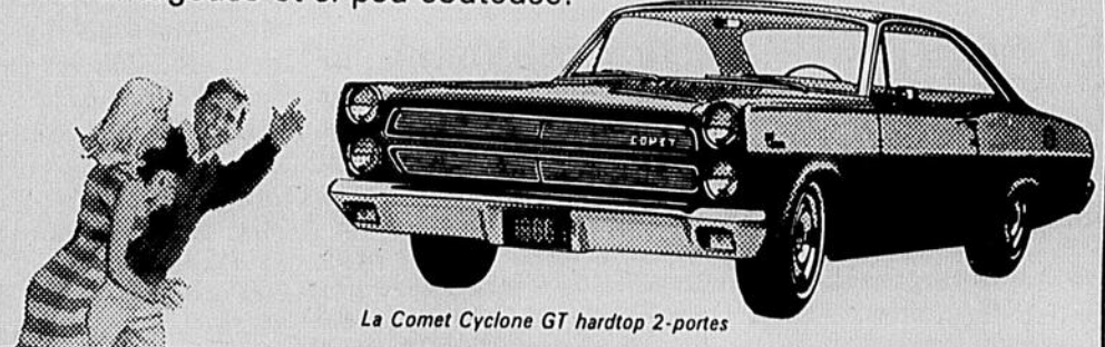
La Comet Cyclone GT hardtop 2-portes