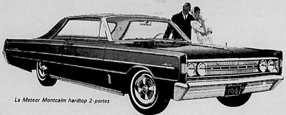
La Meteor Montcalm hardtop 2-portes

La plus grosse voiture au prix le plus bas en ville!