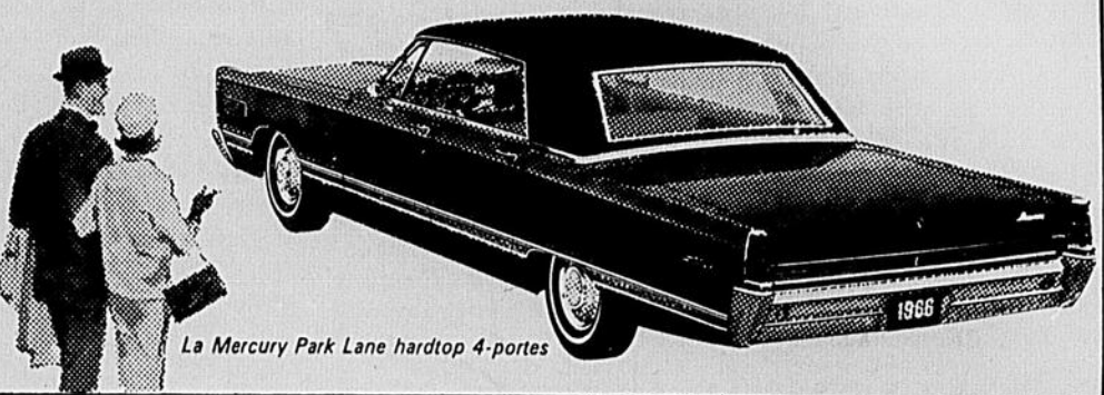
La Mercury Park Lane hardtop 4-portes

Une merveilleuse voiture qui coûte bien moins que vous ne pensez!