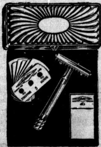
Modèle-poche. — Patron étui, $5.00