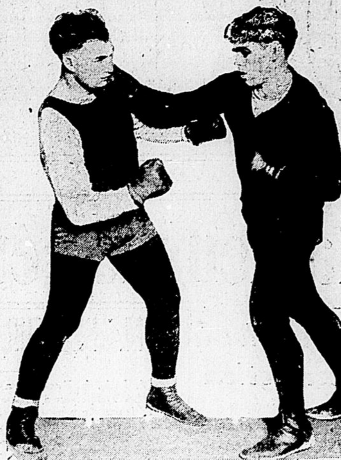
JOE LEWIS & MICKEY WALKER