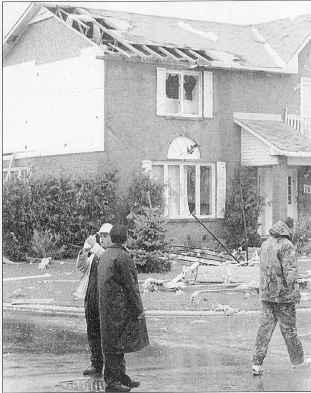
Au total, une cinquantaine de maisons ont été endommagées à Aylmer par la tornade qui n'a duré qu'une trentaine de secondes.

NDLR: La chronique de M. Jean-Claude Rivest publiée hier dans cette page et analysant les relations entre MM. Jacques Parizeau et Lucien Bouchard comportait une part de mise en scène propre au genre. Les lecteurs auront compris que les citations entre guillemets employées par l'auteur étaient fictives.