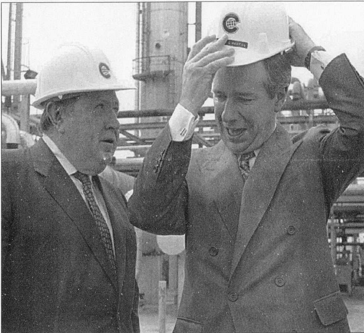
De passage à Montréal pour annoncer la réouverture de l'usine Kemtec à Montréal-Est en compagnie du premier ministre Johnson, l'homme d'affaires américain Oscar S. Wyatt (à gauche) a qualifié d'«enjeu local» l'élection québécoise du 12 septembre prochain. Voir autres informations en page A 5.