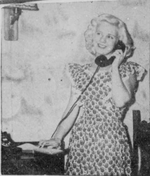
★ C'est sûrement l'appel téléphonique d'un admirateur! On voit ici le sourire qui a rendu célèbre notre jeune compatriote.