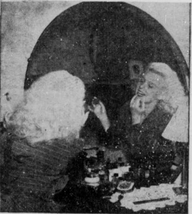
★ Et, il ne faut pas oublier une courte session devant le miroir.