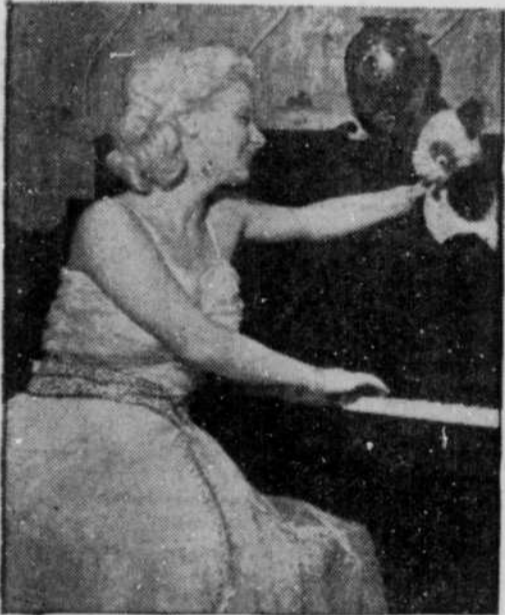
★ On pianote quelques airs au panda favori avant la sortie pour un dîner dans un hôtel de la métropole.