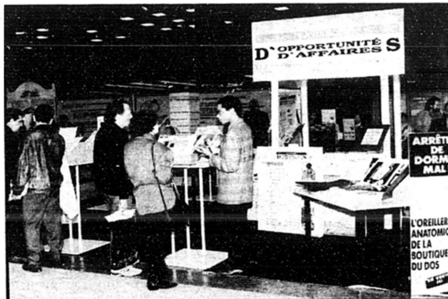
Selon les experts, les franchises constituent une des façons les plus sécuritaires de se lancer en affaires. Des franchiseurs seront sur place pour discuter de votre projet d'entreprise.

Venez valider vos idées au Salon. Vous y trouverez une information de pointe sur tous les aspects de votre démarrage, qu'il s'agisse de votre plan d'affaires, des programmes d'aide ou des sources de financement. Les clés du succès vous attendent au Salon Démarrage d'Entreprises présenté par la Revue Occasions d'Affaires.