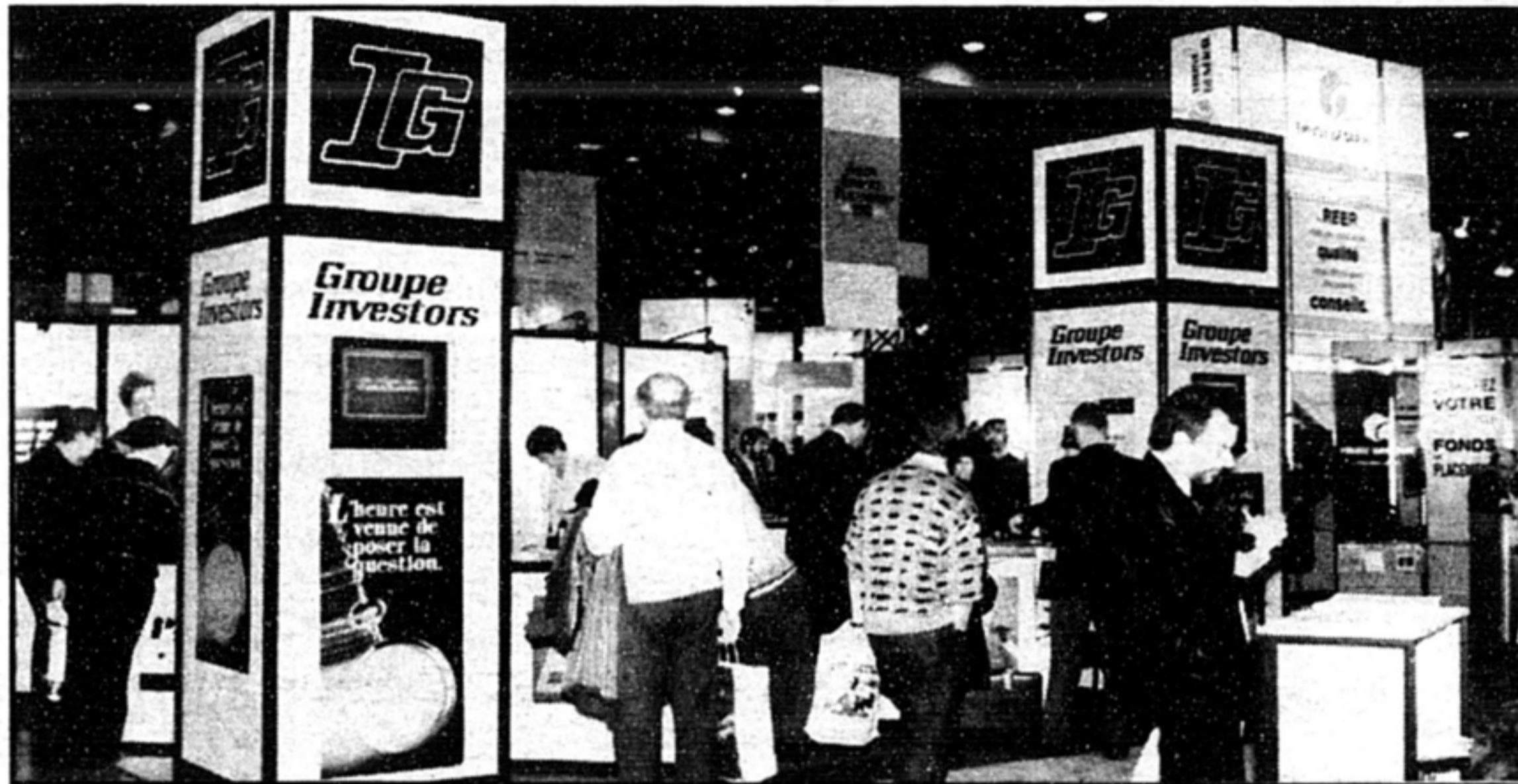
Les visiteurs trouveront au Salon le plus grand nombre de fonds mutuels jamais réunis sous un même toit.

Un petit conseil: cessez de mettre tous vos oeufs dans le même panier. Vous devez di-