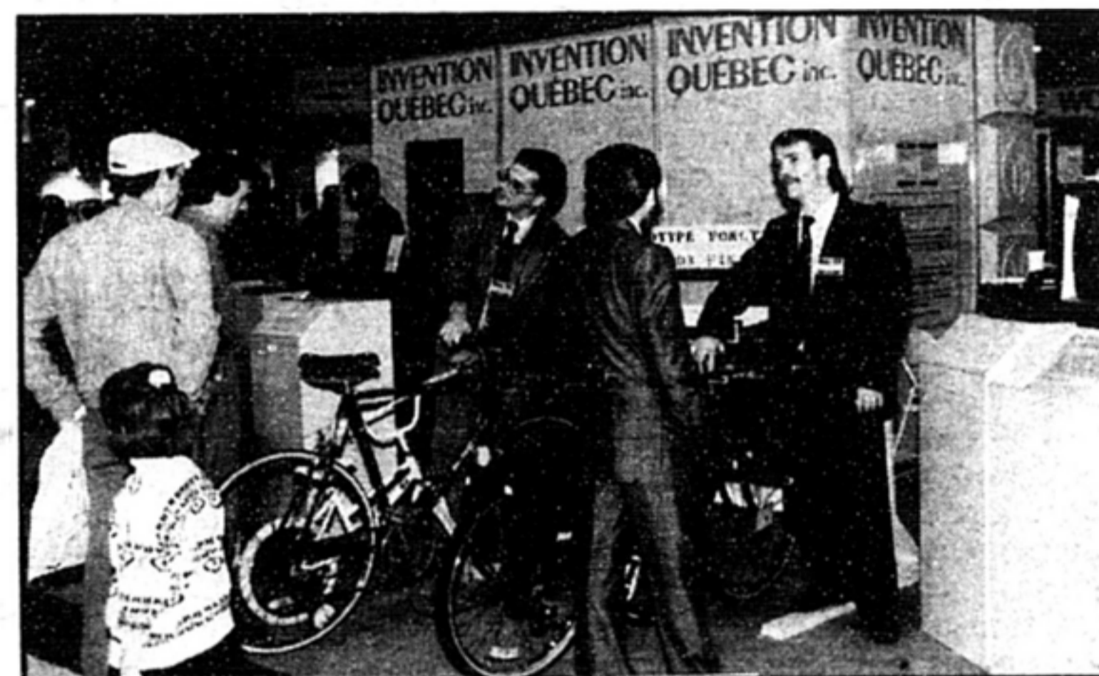
LA VITRINE DES INVENTEURS: Invention Québec vous invite à dénicher l'idée à succès, le produit révolutionnaire, le nouveau concept qui n'attend que vous pour prendre son envol!