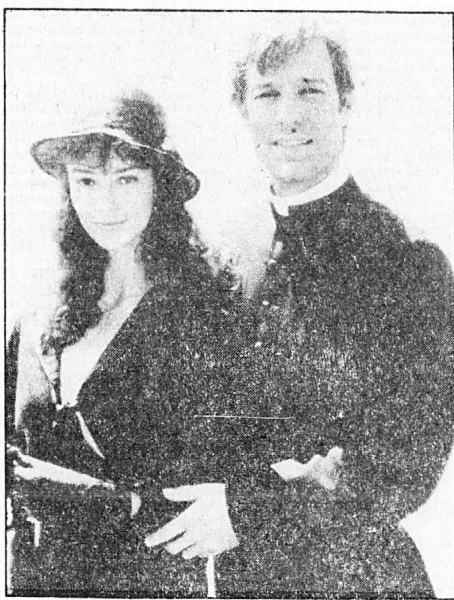
Rachel Ward et Richard Chamberlain: un bon p'tit goût de pas permis.