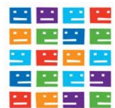
Forum sur la création littéraire au Québec

L'écrivain Louis Hamelin a obtenu le Prix des libraires pour la catégorie « Roman québécois » pour sa fresque historique La constellation du Lynx , parue l'automne dernier aux Éditions du Boréal. Cet honneur était accompagné d'un montant du CALQ de 2 000 $. >>> détails