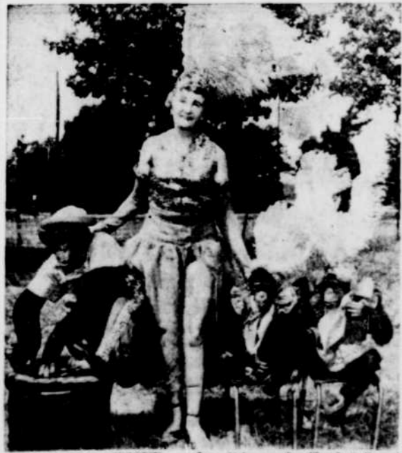
AU CENTRE CIVIQUE. — Les "singes de Charlotte" qui seront en vedette au Cirque Hamid-Morton, samedi et dimanche prochains, 3 et 4 juin, au Centre civique de Drummondville. Cette grande manifestation est organisée dans le but de venir en aide au club de hockey, les Rockets de la Ligue provinciale.

Le public est cordialement invité à se rendre encourager les demoiselles par leur présence à l'exposition qui débutera à 7h30 ainsi qu'à la parade de modes qui débutera à 8 heures p.m. Ces deux démonstrations auront lieu demain seulement dans la salle de l'école secondaire Albert L'Heureux de Coaticook.