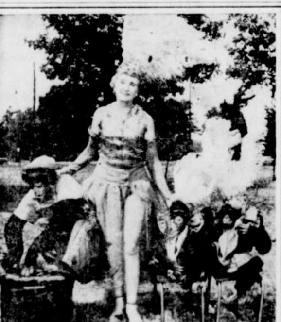
AU CENTRE CIVIQUE. — Les "singes de Charlotte" qui seront en vedette au Cirque Hamid-Morton, samedi et dimanche prochains, 3 et 4 juin, au Centre civique de Drummondville. Cette grande manifestation est organisée dans le but de venir en aide au club de hockey, les Rockets de la Ligue provinciale.

THETFORD MINES, (M.D.) — La Commission scolaire régionale de l'Amiante a modifié quelques clauses du fonds de pension de son personnel non-académique.