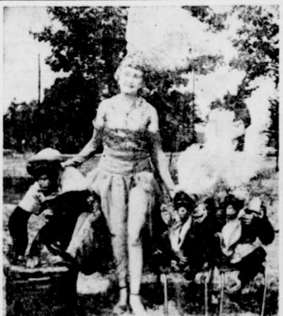
AU CENTRE CIVIQUE. — Les "singes de Charlotte" qui seront en vedette au Cirque Hamid-Morton, samedi et dimanche prochains, 3 et 4 juin, au Centre civique de Drummondville. Cette grande manifestation est organisée dans le but de venir en aide au club de hockey, les Rockets de la Ligue provinciale.

L'évaluation globale des industries s'établit à $29,743,400, celle des compagnies, $875,105, et des autres propriétés, résidences, magasins, à $43,696,270, ce qui fait un total de $65,134,675.