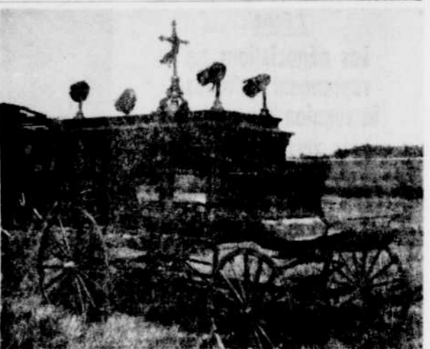
PIECE D'ANTIQUITE — Defoy, petite localité située à quelques milles de Victoriaville, est le rendez-vous d'amateurs d'antiquités qui y trouvent tout ce qu'ils désirent; c'est ainsi que, hier, le corbillard que l'on voit sur cette photo, corbillard datant d'environ 75 ans, comptait ses derniers jours à Defoy; un acheteur d'Edmonton en a pris possession.

La souscription pour les JEUN'ÈRES se poursuit toujours à Victoriaville... Ces jeunes seraient sur le point d'annoncer leur local régulier.