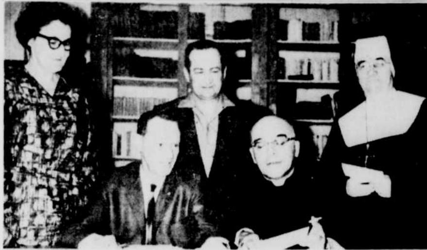
CORPORATION DU FOYER DU LAC NOIR — La Corporation du Foyer du Lac Noir a lancé sa grande campagne de souscription populaire. Le cliché en montre ci-haut...