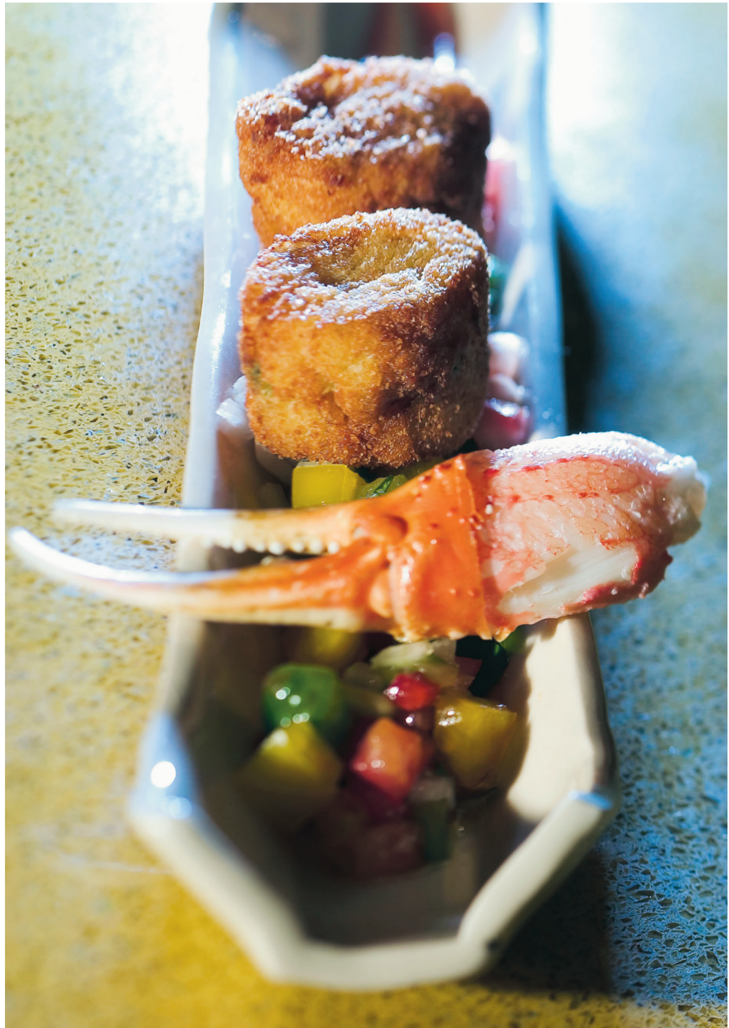
Gâteau de crabe des neiges et salsa de poivrons