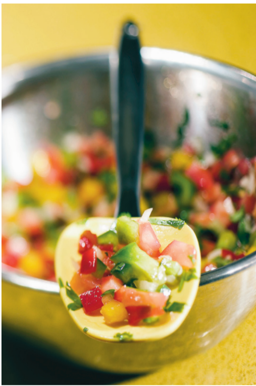
Salsa de poivrons