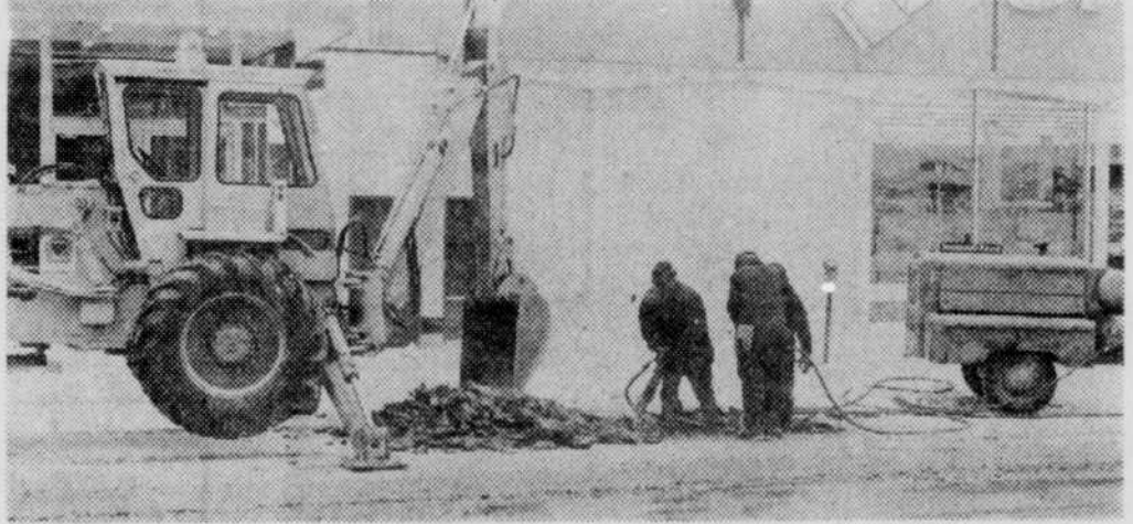
Les employés de la Voirie municipale ont travaillé toute la journée pour mettre un point final à cet épanchement d'eau au centre-ville.