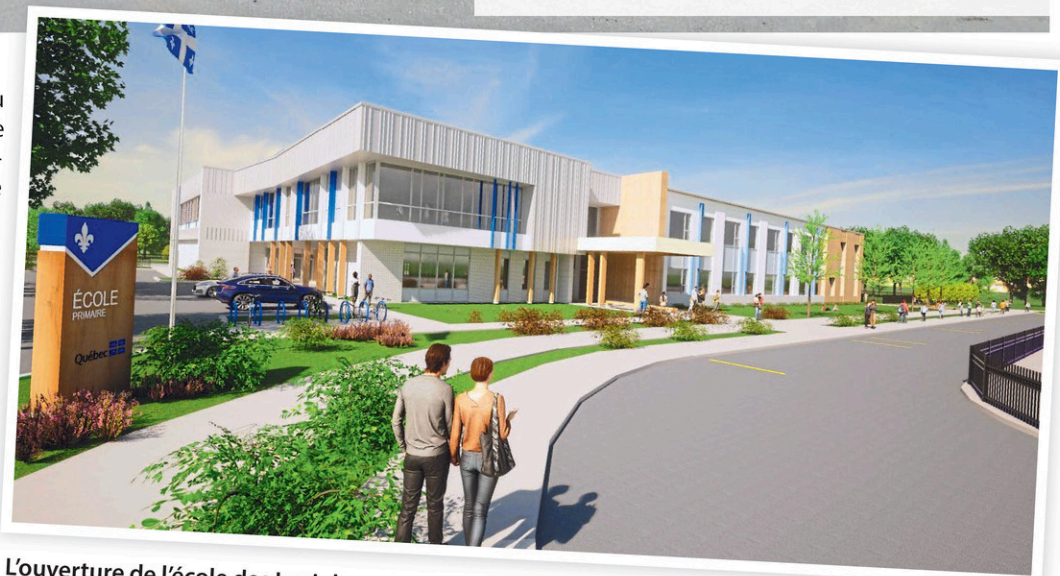
L'ouverture de l'école des Lucioles est prévue pour l'année scolaire 2025-2026.