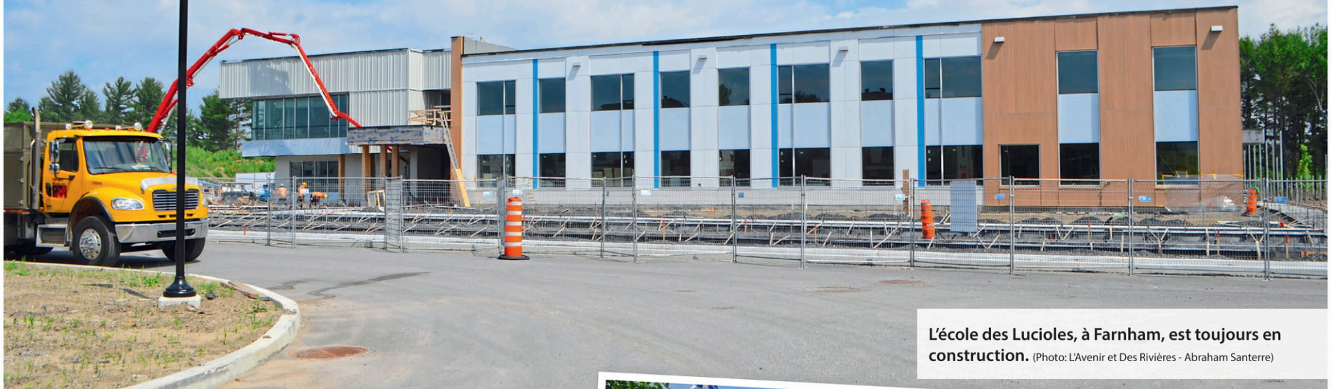
L'école des Lucioles, à Farnham, est toujours en construction.