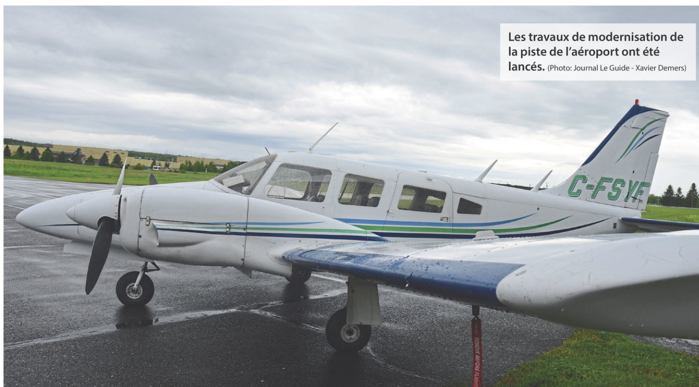
Les travaux de modernisation de la piste de l'aéroport ont été lancés.

« C'est plus d'une cinquantaine de travailleurs de la région qui vont participer au projet », note Simon Villeneuve.