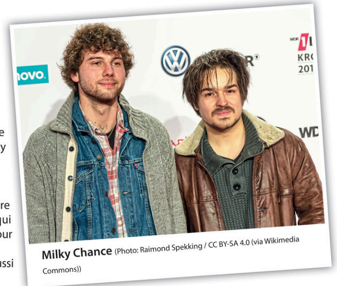
Milky Chance

Le camping éphémère est également de retour cette année.