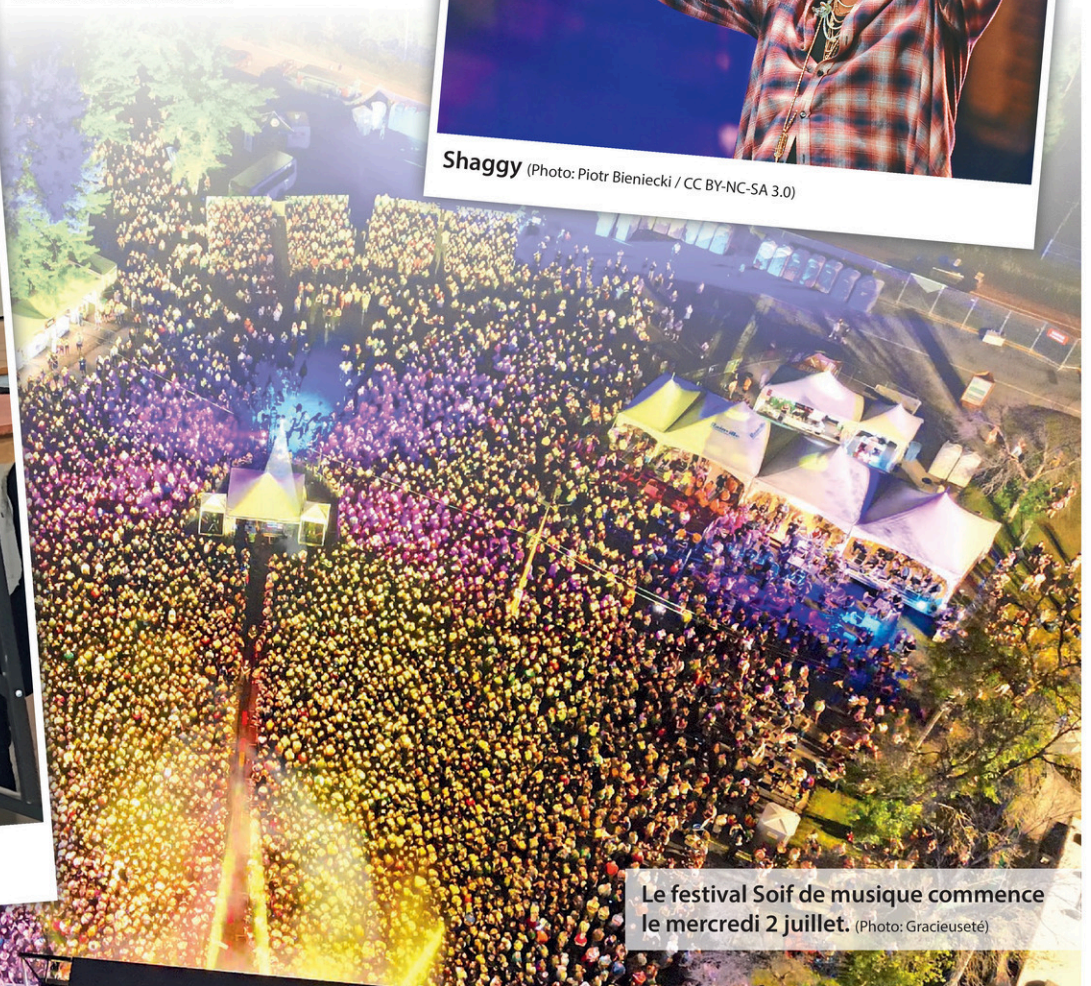
Le festival Soif de musique commence le mercredi 2 juillet.