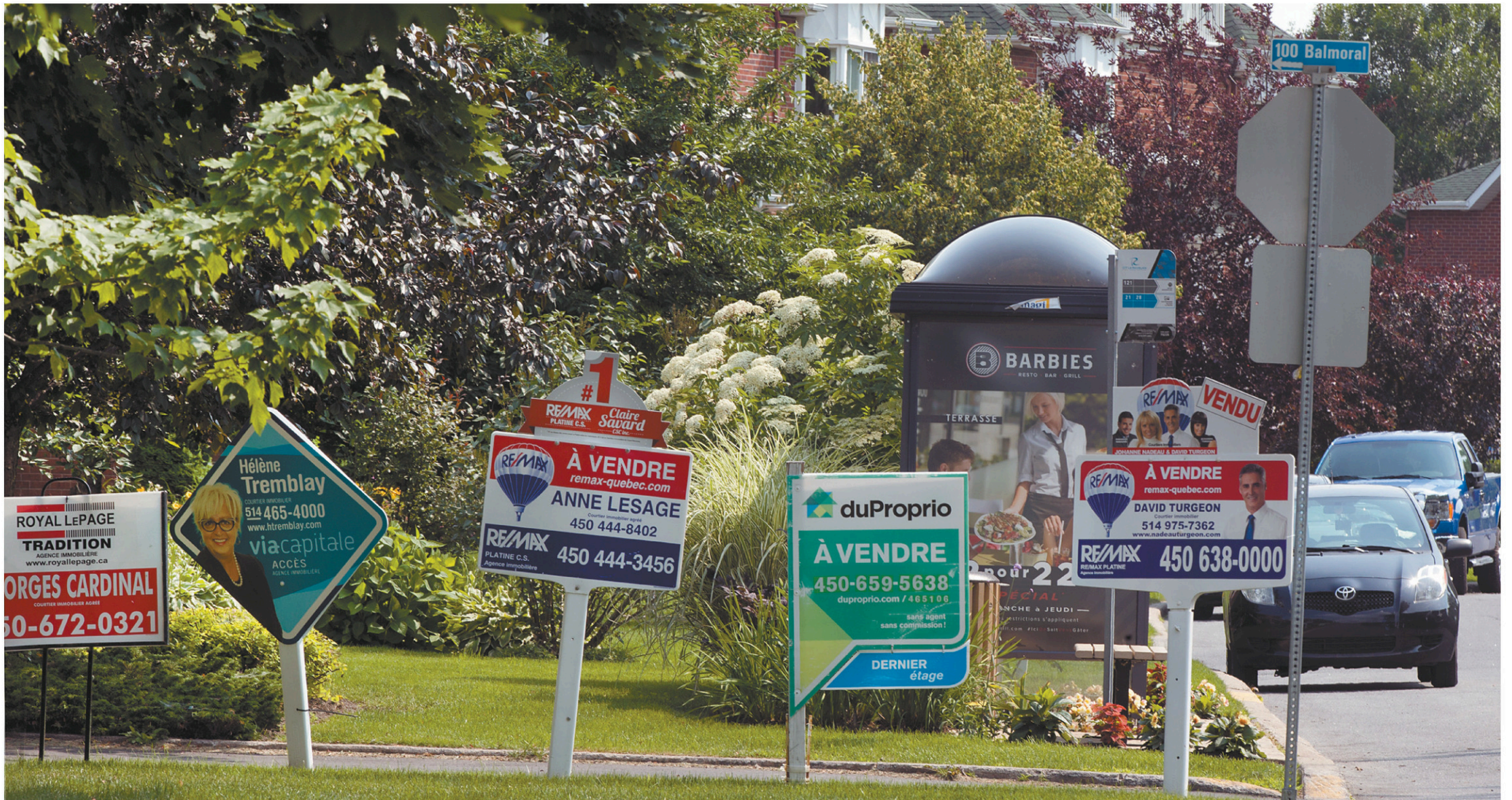
L'OSBL Vivacité tente de développer au Québec le modèle des « habitations abordables à perpétuité », qui vise à réguler la spéculation immobilière, en réduisant les profits dont bénéficiera le revendeur. JACQUES NADEAU LE DEVOIR