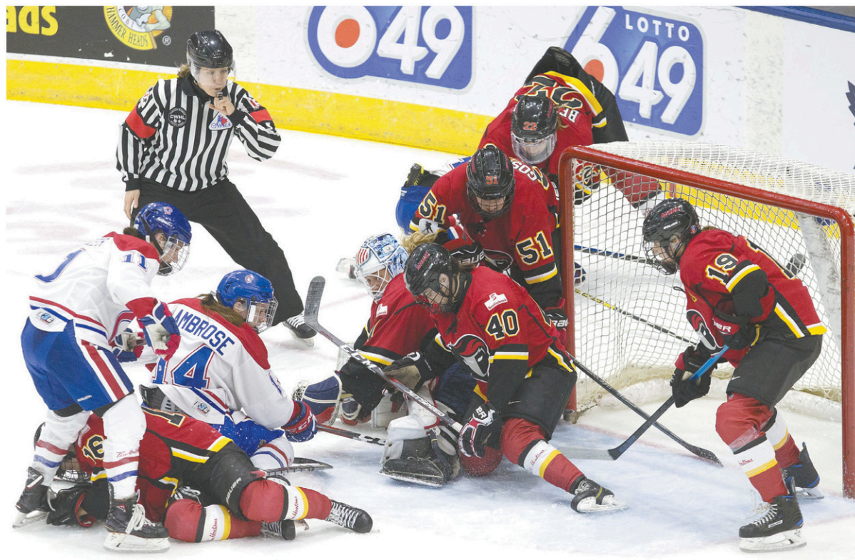
Les Canadiennes de Montréal et l'Inferno de Calgary se sont affrontés en finale de la Ligue canadienne de hockey féminin, le 24 mars dernier.

« C'est ce que je veux continuer de croire ce matin. Il y a eu un long et pé-