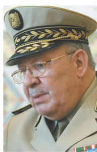
Ahmed Gaïd Salah

dans le ministère désormais sous leur tutelle.