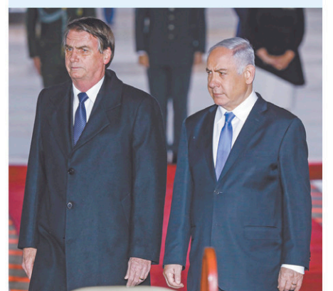
Le premier ministre Nétanyahou (à droite) a accueilli dimanche le président brésilien lors de son arrivée en sol israélien.

JÉRUSALEM — Le premier ministre israélien, Benjamin Nétanyahou, et le président brésilien, Jair Bolsonaro, en visite en Israël, ont scellé dimanche six accords de coopération entre les deux pays, portant notamment sur la coopération dans les domaines de la défense, de la sécurité et des technologies. « Nous écrivons l'histoire ensemble, a déclaré M. Nétanyahou. Nous avons ouvert une nouvelle ère dans les relations entre nos deux pays. » Le premier ministre israélien est l'un des rares dirigeants de premier plan à avoir fait le déplacement au Brésil début janvier pour l'investiture du président Bolsonaro. Pour M. Nétanyahou, la visite officielle du président brésilien d'extrême droite, qui doit durer trois jours, arrive à point nommé : en pleine campagne électorale pour les législatives du 9 avril, il peut se targuer d'avoir obtenu le soutien implicite du président de la plus grande puissance d'Amérique latine. Agence France-Presse