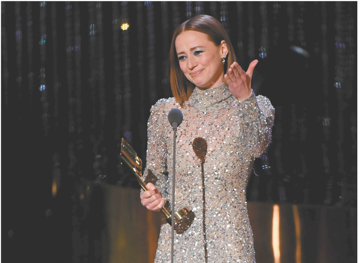
Karine Vanasse a remporté un des premiers prix accordés au cours de la cérémonie des prix Écrans canadiens en soirée, dimanche. La comédienne a obtenu la récompense pour la meilleure actrice dans un rôle principal, série dramatique, pour son jeu dans Cardinal . Lisez la couverture complète des prix Écrans canadiens sur nos plateformes numériques.

Au théâtre Le National mardi et au Palais Montcalm mercredi