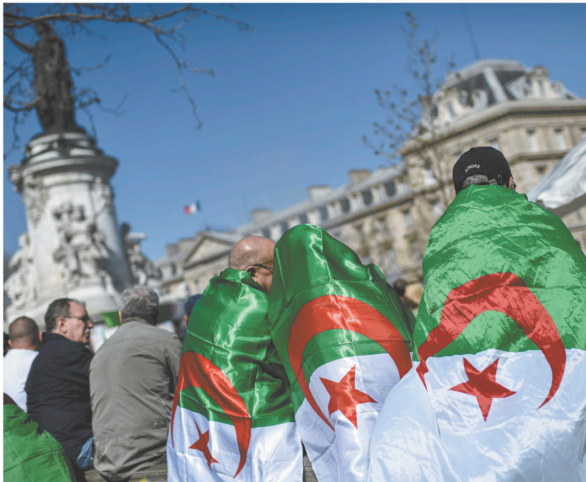
Des milliers de protestataires ont manifesté leur rejet du régime d'Abdelaziz Bouteflika, dimanche, à Paris.

La campagne pour ce scrutin, le huitième d'un épuisant cycle électoral entamé en 2014, a une nouvelle fois polarisé le pays. Deux personnes ont notamment été tuées par balles à Malatya, selon les autorités, et quatre personnes ont été arrêtées.