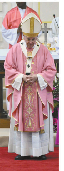
Le pape François célébrait dimanche une messe dans un complexe sportif de Rabat.

Moment fort de son déplacement, une déclaration commune appelant à « préserver » Jérusalem comme « lieu de rencontre et symbole de coexistence pacifique où se cultivent le respect réciproque et le dialogue » a été signée samedi par le chef des catholiques et le commandeur des Croyants.