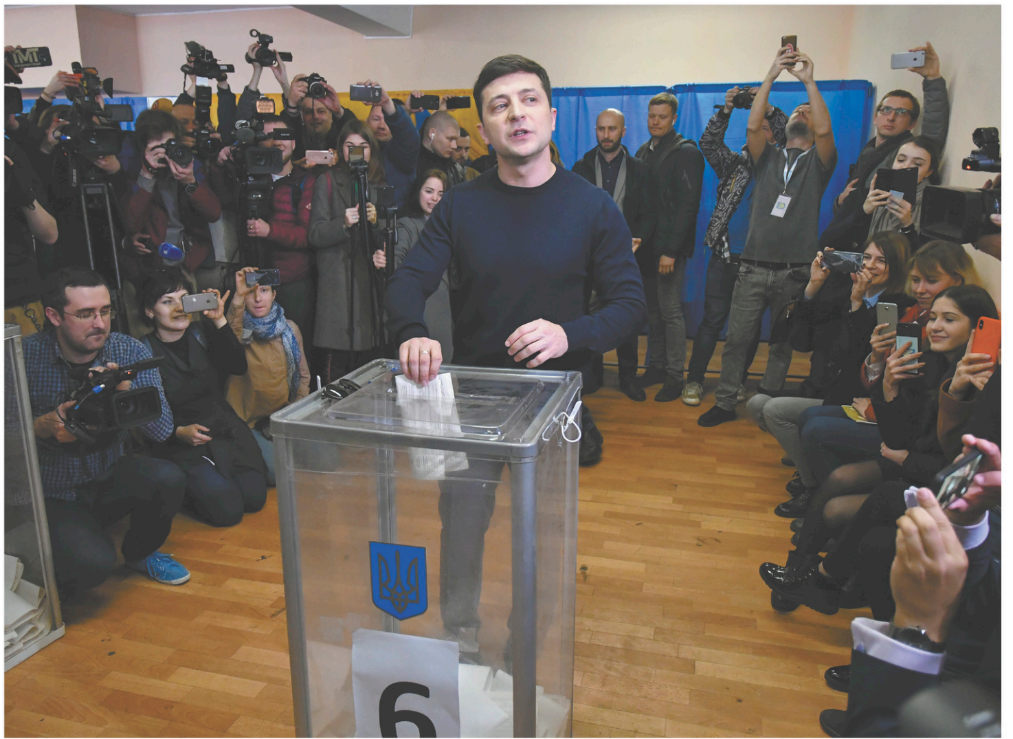
Le comédien Volodymyr Zelensky s'est rendu dimanche dans un bureau électoral de Kiev pour y voter devant la presse.

Les aspects partiellement démocratiques du système, dans un pays où on laisse volontiers quelques journaux d'opposition chialer (ce qu'ils font avec talent), et où on peut manifester en masse, ne suffisent plus... Dans leur idéalisme, les Algériens réclament désormais le droit tout simple de pouvoir pacifiquement congédier leurs dirigeants. Comment ça s'appelle déjà ?