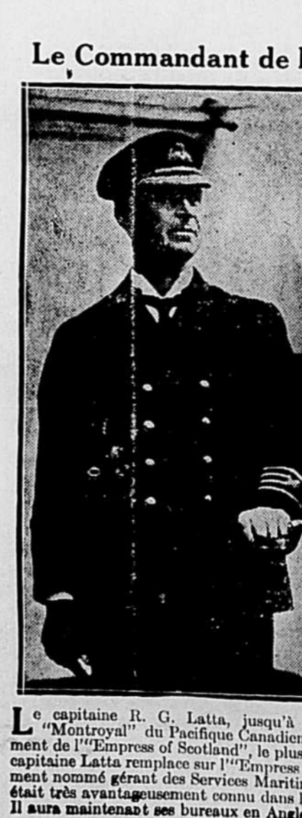
Le capitaine R. G. Latta, jusqu'à ces derniers temps commandant du "Montroyal" du Pacifique Canadien, à qui vient d'être confié le commandement de l'"Empress of Scotland", le plus gros paquebot de cette compagnie. Le capitaine Latta remplace sur l'"Empress of Scotland" le capitaine Gillies, récemment nommé gérant des Services Maritimes du Pacifique Canadien. Ce dernier était très avantageusement connu dans les cercles maritimes de l'est du Canada. Il aura maintenant ses bureaux en Angleterre.