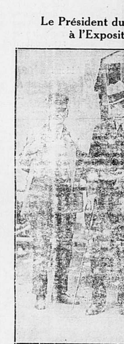
Lors de la visite qu'il fit à la grande exposition de Toronto, qui, cette année, a attiré dans la capitale de l'Ontario des centaines de milliers de visiteurs, M. E. W. Beatty, président du Pacifique Canadien, s'est vivement intéressé à la "Lucey Dalton", une ancienne locomotive qui fut l'une des premières construites par la Compagnie. Cette locomotive fut d'ailleurs un objet de grande curiosité pour tous ceux qui visitèrent l'exposition.