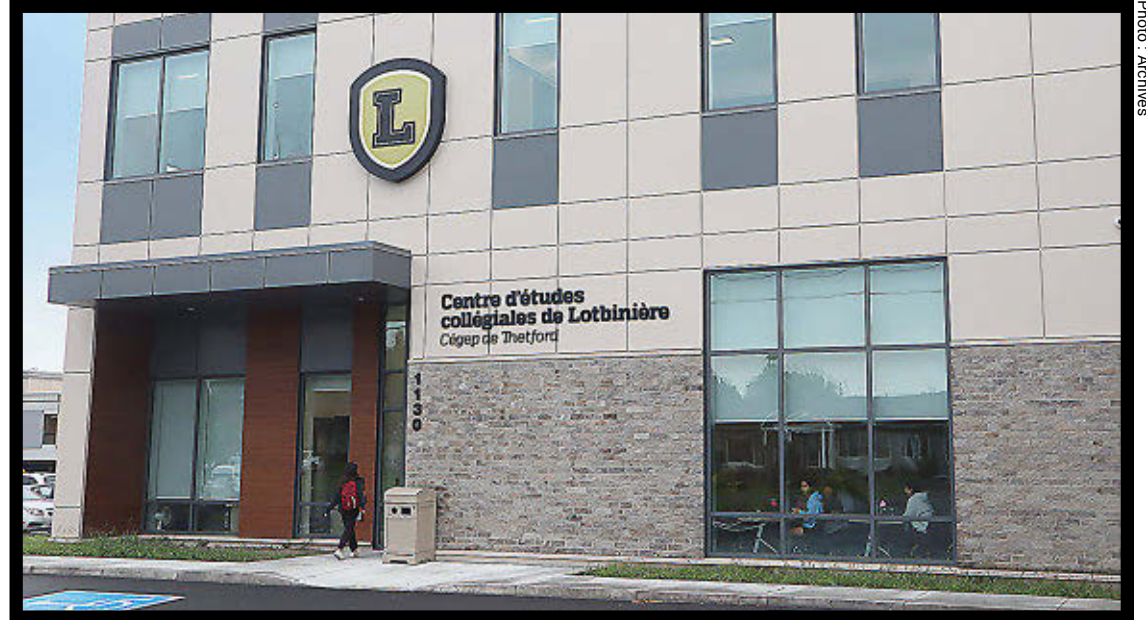
Les contraintes budgétaires imposées aux cégeps ne devraient pas affecter le CEC de Lotbinière.

Cet argent que l'institution ne peut pas déboursier n'est pas perdu. «Ces montants seront répartis autrement dans le temps. Cela devrait revenir plus tard. Dans cinq ans, cela devrait être réinscrit dans le budget», spécifie M. Rousseau.