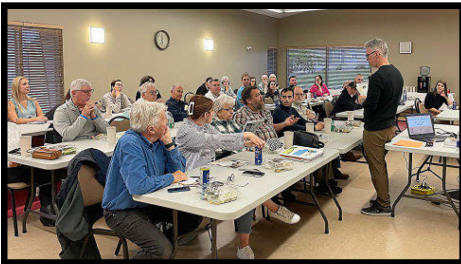
Plus de 30 personnes ont assisté à une formation offerte par la SADC de Lotbinière.

La formation Concevoir une gouvernance qui fait du sens pour un conseil d'administration a attiré 34 personnes à Saint-Flavien le 8 octobre dernier.