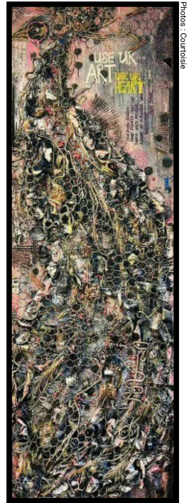
L'œuvre mise à l'enchère, Le paon .

Plus tard, elle s'est aussi inscrite au Projet relève du Vieux Bureau de Poste, à Lévis. Son dossier de candidature a été retenu et plusieurs de ses toiles sont actuellement exposées dans la petite salle de spectacle du quartier Saint-Romuald, à Lévis.