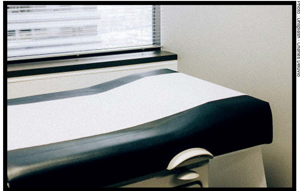
Le Plan régional d'effectif médical accorde 29 médecins à la région Chaudière-Appalaches pour l'année 2025.

Rappelons que pour améliorer l'accès aux soins le ministre de la Santé et des Services sociaux, Christian Dubé, et la ministre de l'Enseignement supérieur, Pascale Déry, ont annoncé en 2023 qu'il y aurait une augmentation des admissions en médecine de 404 places au cours des trois années suivantes, afin de former 660 médecins supplémentaires sur quatre ans en 2026-2027.