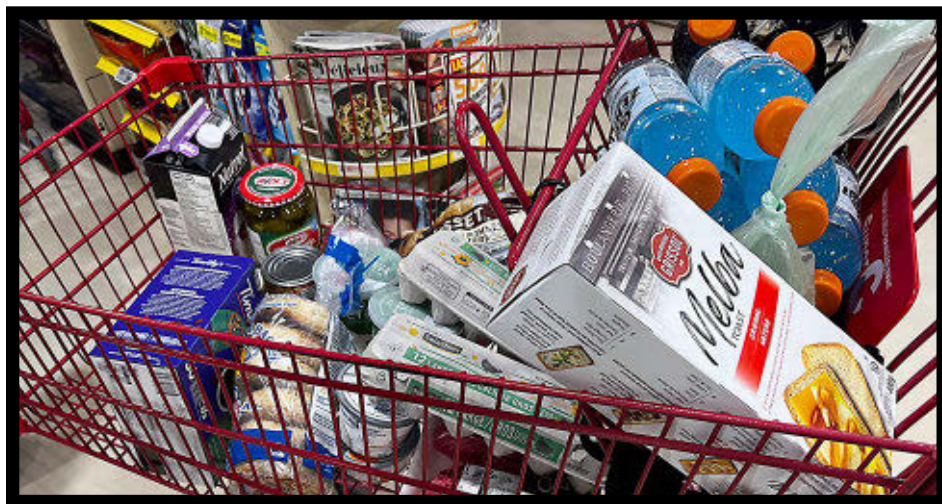
Certains Québécois coupent dans leurs dépenses en alimentation.

Un Québécois sur cinq couperait dans ses dépenses en alimentation pour économiser de l'argent. C'est l'un des constats qui ressort d'un sondage Ipsos réalisé pour le compte de MNP.