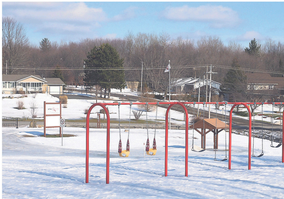
Shefford a investi dans ses parcs au fil des années.

Outre les fêtes d'Halloween, de Noël ou de Pâques, soulignées par des activités familiales, plusieurs autres rendez-vous permettent aux Sheffordois de se regrouper. Les familles trouveront leur compte avec les activités comme Viens jouer au parc!, Les plaisirs d'hiver ou la Pêche en herbe, par exemple, alors que les plus âgés peuvent se rencontrer chaque vendredi après-midi au parc