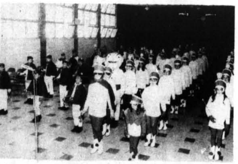
Photo prise lors du couronnement de la Reine du Carnaval de Montebello, dimanche dernier, à l'Ecole St-Michel.

La salle de quilles remercie sa clientèle de leur visite à l'occasion de ce carnaval; aussi la direction de cette salle organise à tous les vendredis de ces tournois, afin de toujours demeurer dans cette atmosphère de carnaval. De nombreux prix y seront distribués en plus de trophées distinctifs. Tous sont bienvenus à ces compétitions.