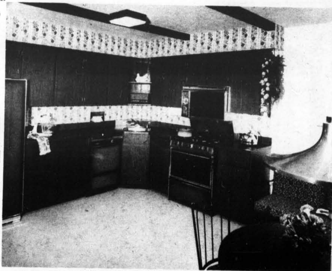
Cet élégant ensemble Cuisine/Salle de séjour plaira à tous les membres de votre famille. Les comptoirs et armoires sont recouverts d'un lamellé ARBORITE motif noyer facile d'entretien, rappelant les tons des meubles figurant dans le coin dînette et repos.

Poulet à l'Hawaïenne sur lit de riz garni d'ananas (1 portion) - Pointes d'asperges garnies de farce au citron (1 portion) - Pain français (1 tranche moyenne) - Chutney (2 c. à table) - Pain d'épice (cube de 2") garni d'un quart de tasse de purée d'abricot - Café noir ou thé avec citron.