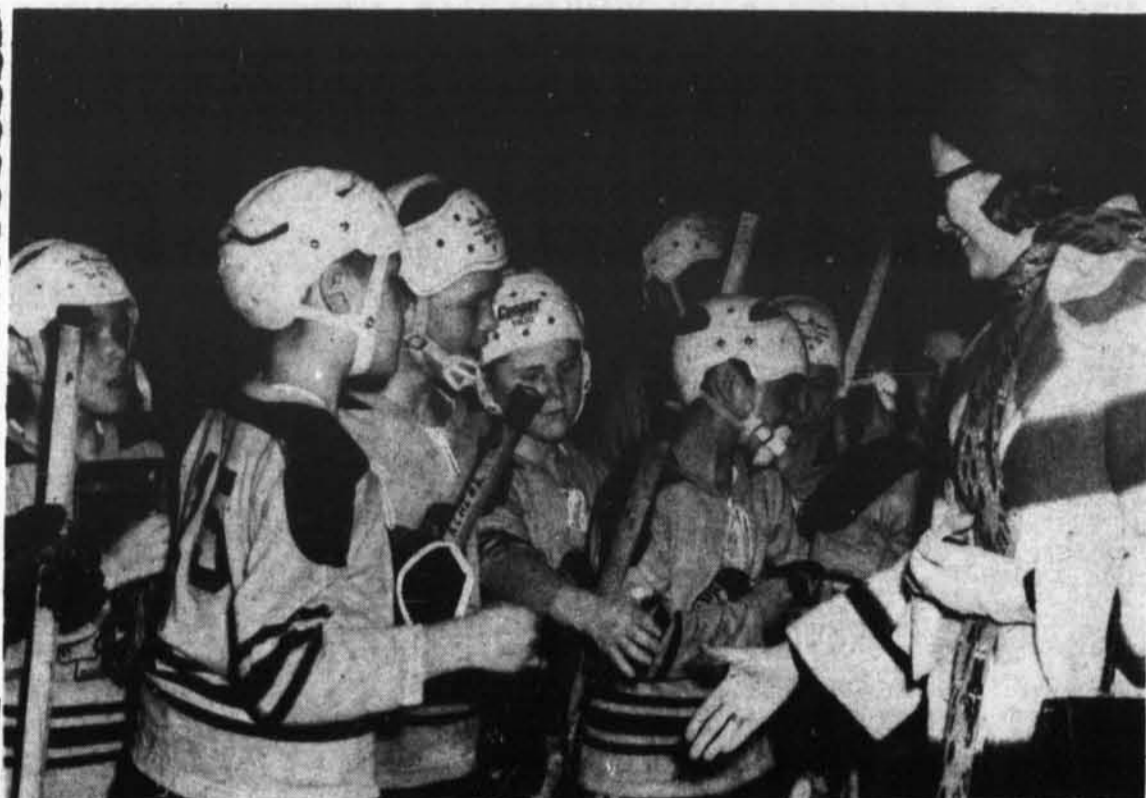
Son Altesse, la Princesse Grace de Monaco, félicite les jeunes Indiens de l'équipe de Caughnawaga.