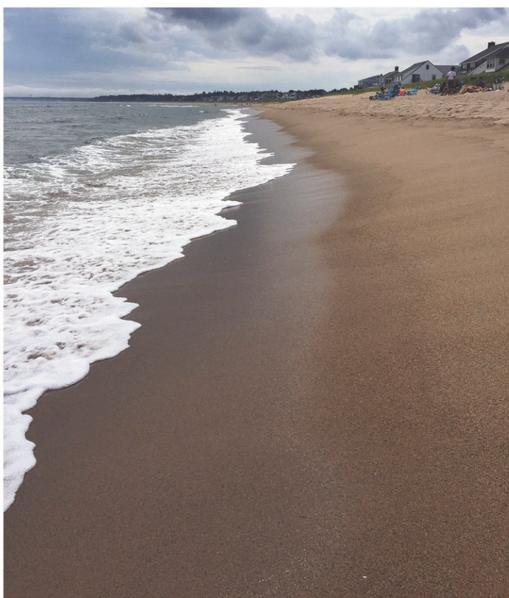
La plage entre Pine Point et Camp Ellis, longue de quelque 15 kilomètres: génial pour courir ou randonner. À droite: la pêche aux palourdes à Pine Point (Scarborough).