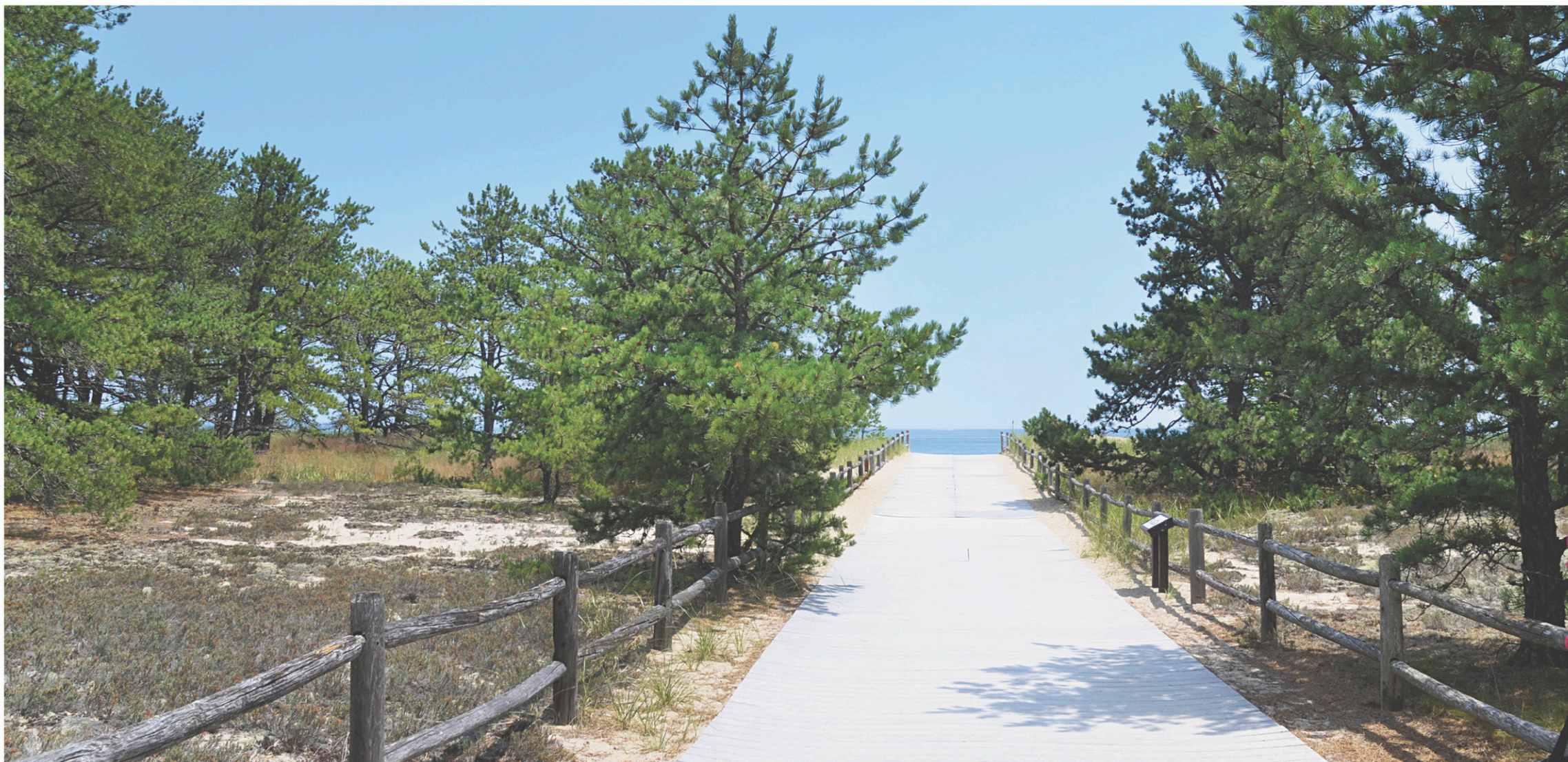
La promenade du parc d'État Ferry Beach

Loin de nous le temps où le dummy , ce train qui, au XIX e siècle, emmenait les estivants d'Old Orchard à Camp Ellis pour y prendre le traversier (d'où « Ferry Beach ») vers Biddeford Pool, le temps d'un thé. Comme il n'avait aucun endroit pour tourner à Camp Ellis, le train revenait à reculons à Old Orchard. D'où son nom.