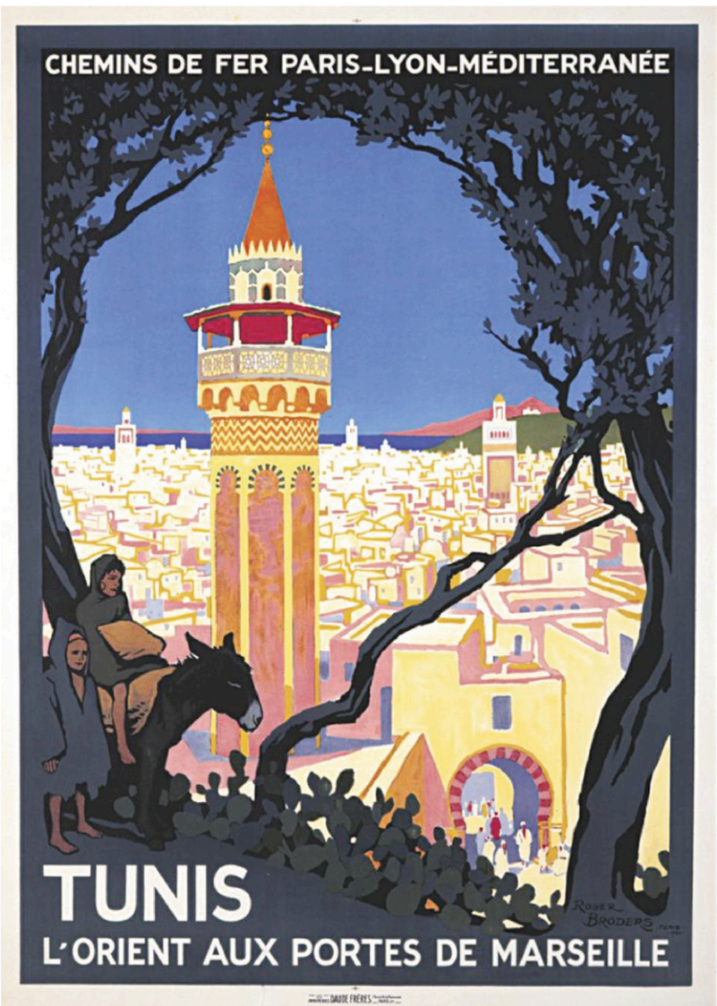
Des affiches présentées à l'exposition Broders, le voyage au Musée de l'affiche de Toulouse, dans le sud-ouest de la France.

dad au départ de Londres, nous renseigne Broders au moyen d'une affiche qui met en vedette l'arche de Ctésiphon. Située en bordure du Tigre, cette ancienne ville de Mésopotamie, berceau de l'humanité, était un lieu de résidence royal.