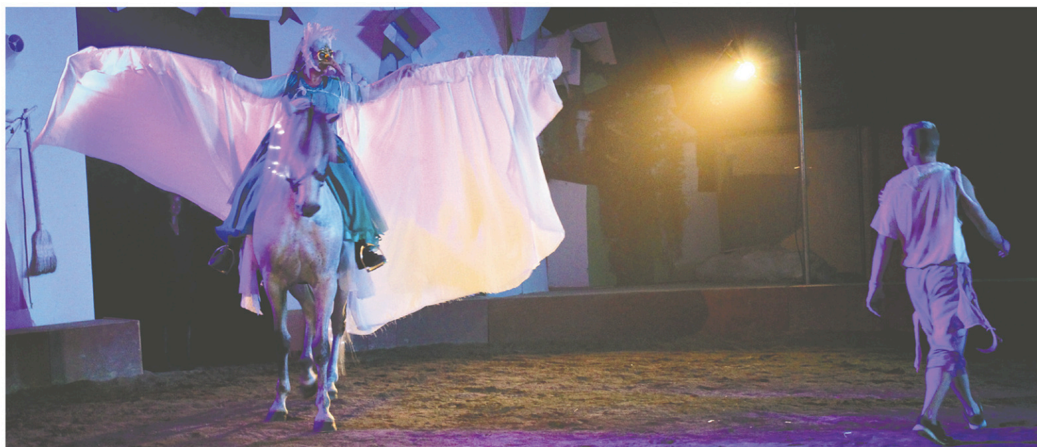
Redonnant au cheval sa place primordiale, Ekasringa crée une synergie entre hommes et animaux.