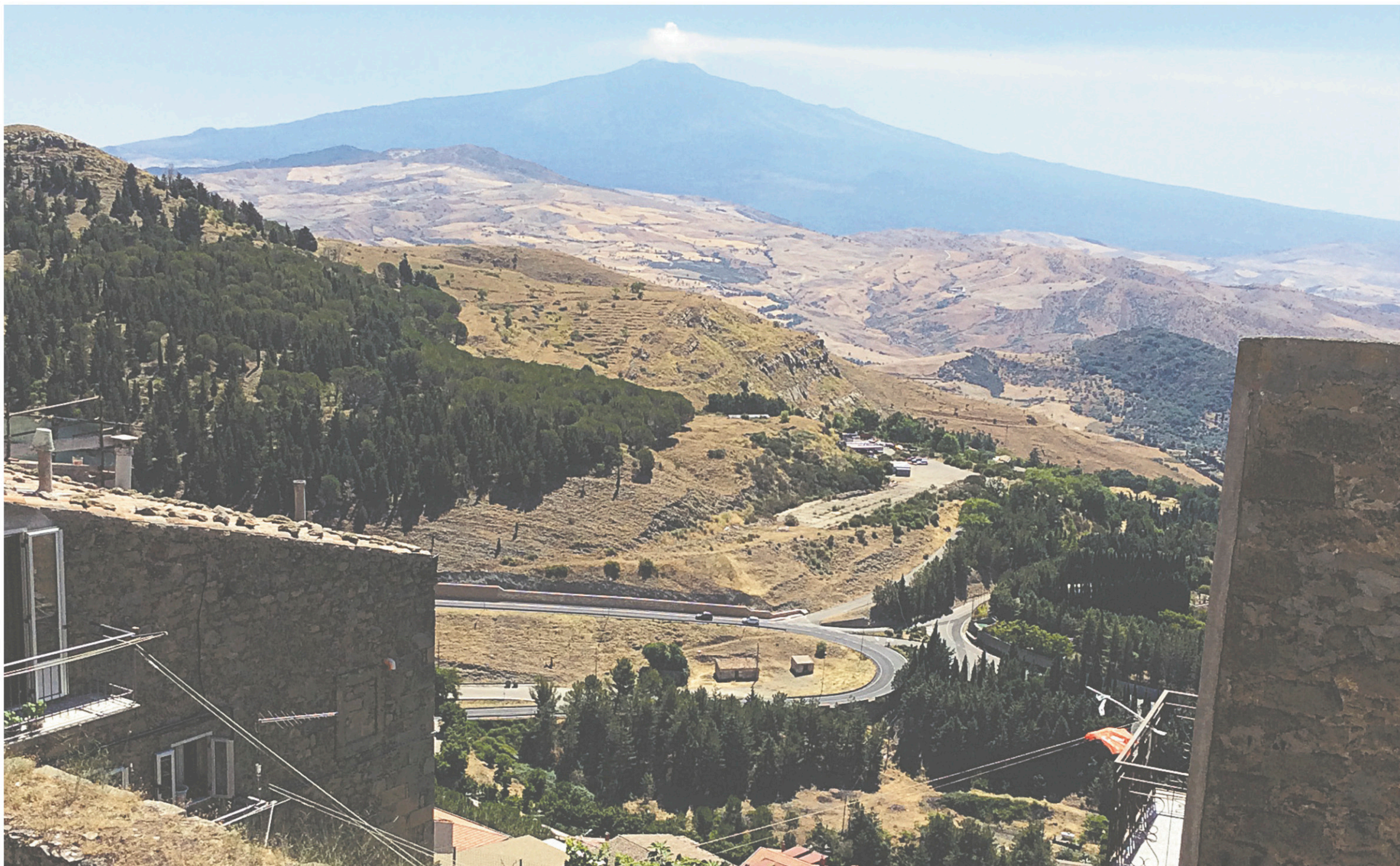
Troina fut la première capitale normande de la Sicile. Au loin, le volcan Etna se dresse devant la commune italienne, culminant à 3330 mètres d'altitude.

Année après année, le nombre de découvreurs et de mangeurs de vastedda augmente. C'est que la commune de Troina valorise cette recette ancienne, notamment lors de la fête qui lui est consacrée en juin, la Sagra della vastedda cu sammucu .