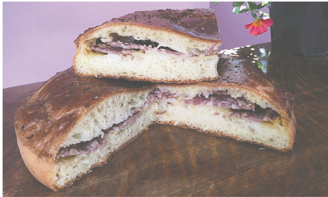
La vastedda cu sammucu se mange préférentiellement chaude. Celle-ci a refroidi avant de se faire photographier, puis dévorer!

Même les traditions les plus enracinées évoluent au fil du temps. La vastedda n'y échappe pas. Si les familles se lancent encore aujourd'hui dans la fabrication maison de cette focaccia ancienne, elles s'en éloignent par le contenu. «Les interprétations deviennent très personnelles et nombreuses. Certains vont ajouter des petits pois, d'autres vont omettre le saucis-