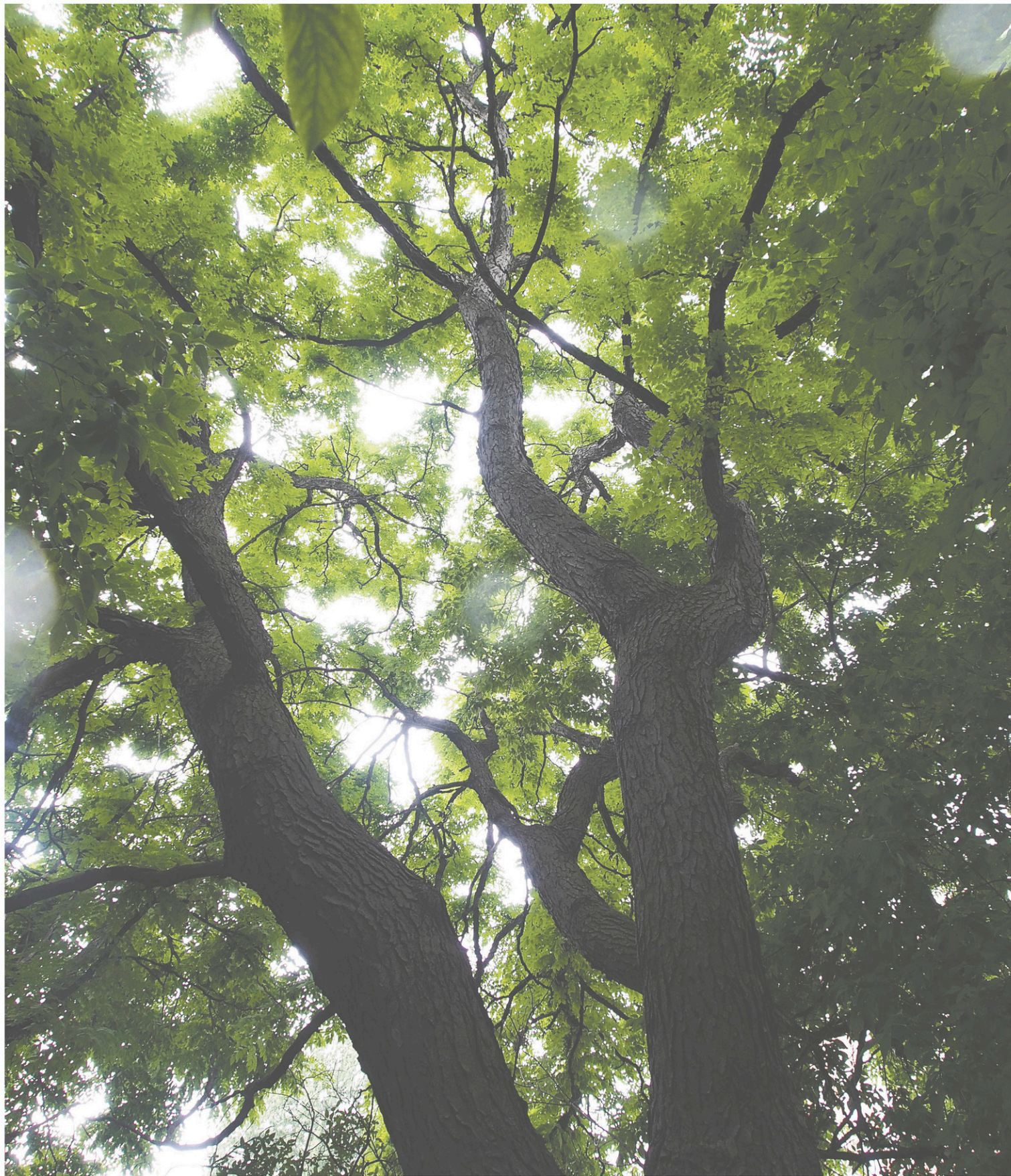
Le jardin derrière la Maison Notman, situé aux limites du Plateau Mont-Royal et du centre-ville, est peuplé d'arbres remarquables, parmi lesquels font partie cinq érables argentés ( Acer saccharinum ).