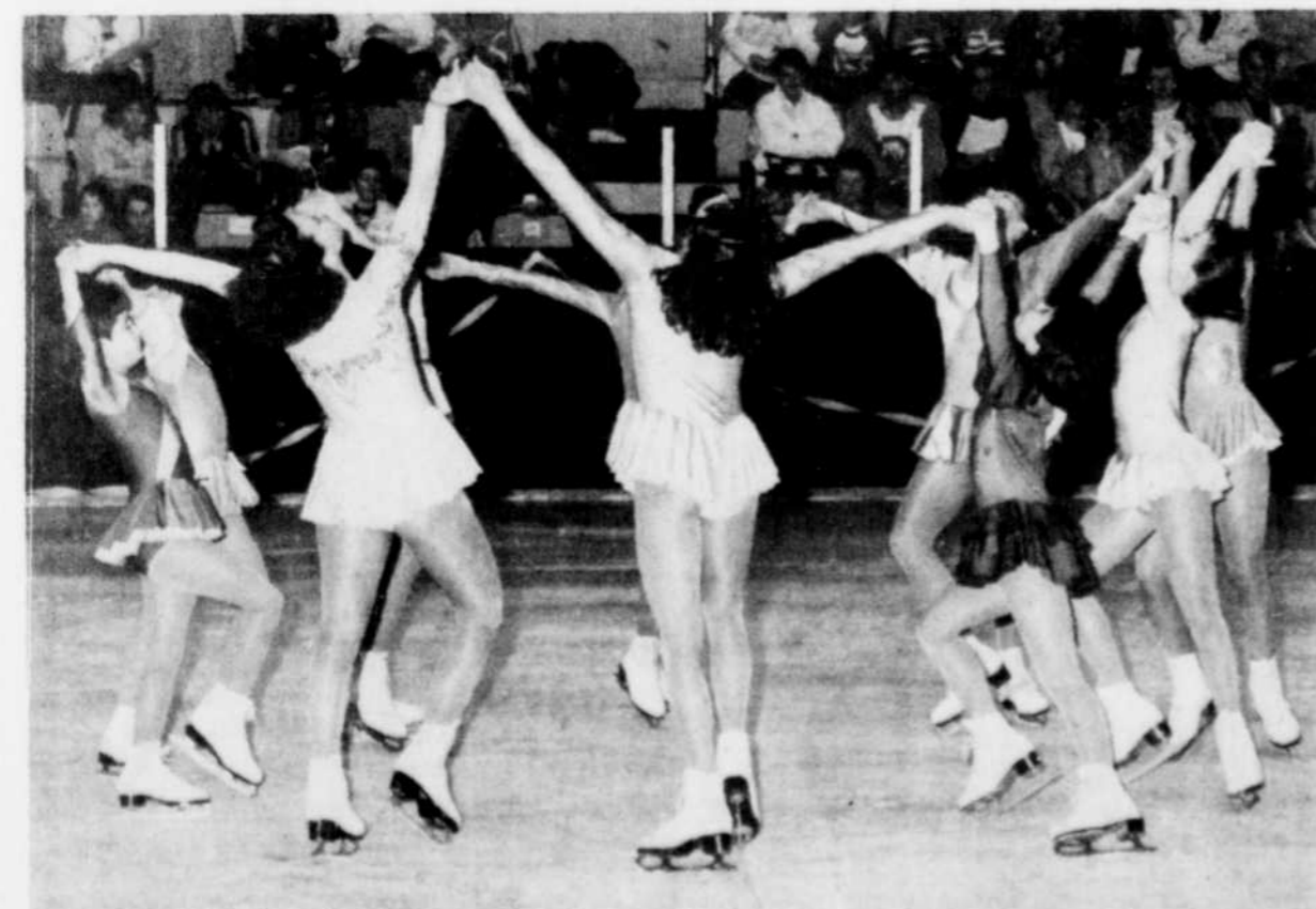
La démonstration annuelle du club des Tournesols s'est terminée sur une belle note à l'aréna Gilles-Bou-rassa.