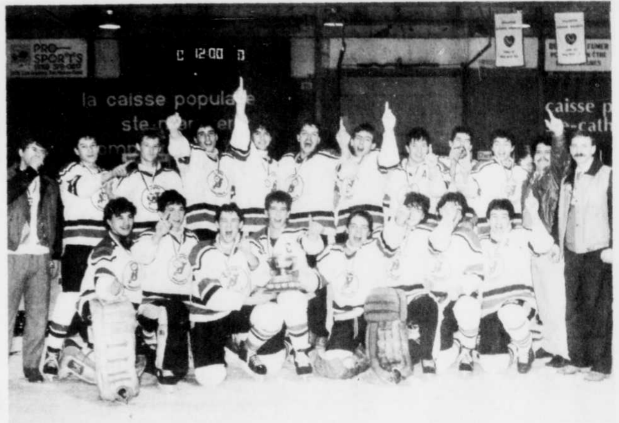
Les Devils midget du Centre-Mauricie ont connu de bons moments durant la dernière saison de hockey mineur. Ils se sont notamment soulagés lors du tournoi provincial midget de Trois-Rivières-Ouest.