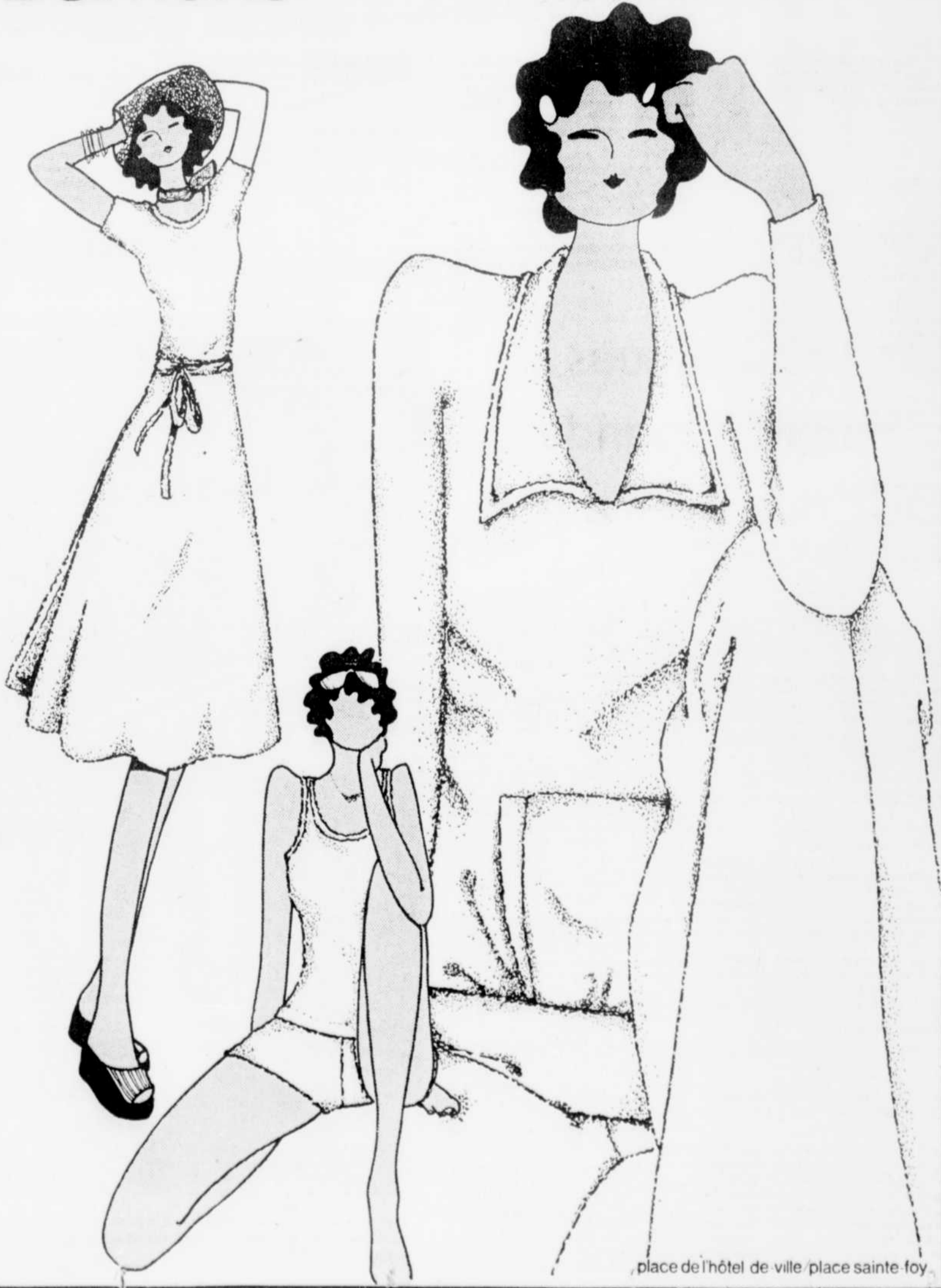
place de l'hôtel de ville place sainte-foy