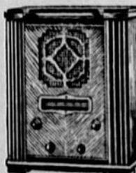
Modèle 62 PRIX: $86.50