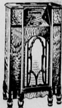
Modèle 72 PRIX: $142.50