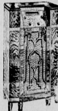
Modèle 63 PRIX: $117.50