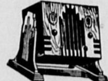
Modèle 55 PRIX: $56.50