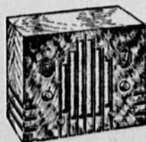
Modèle 53 PRIX: $49.90

Il n'y a rien de plus facile que de syntoniser ce programme particulier et il y en a tant à capter sur le champ immense que couvre le Northern Electric, que vous êtes certain d'en syntoniser un à votre goût ou qui convienne à votre humeur. Un petit paiement comptant met le Northern Electric chez vous. La balance par termes faciles.