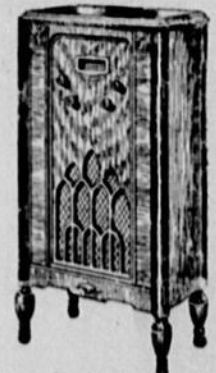
Modèle 54 PRIX: $69.90