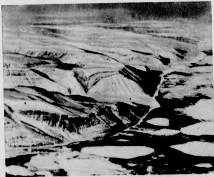
Photo prise le 20 mai par un membre de l'équipage de l'avion Lancaster "Aries" construit en Grande-Bretagne de l'Empire Air Navigation School de la Division de l'entraînement au vol de la R.A.F., lors de son envol au-dessus du Pôle magnétique du Nord de Goose Bay, Canada. Les caméras de la R.A.F. ont pris des photos de la guerre, mais elles ont ici photographié un autre combat gagné par la R.A.F. — le combat contre la Nature.

Photo : Glace de banquise près de la côte-ouest du Groenland.