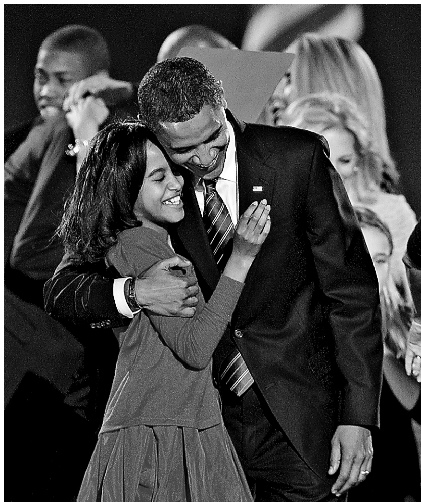
Barack Obama avec sa fille Malia après son discours de la victoire.

cette nuit étoilée et magique. Il a fallu attendre la fin d'un discours sobre, inspirant et émouvant à l'extrême, pour que s'élèvent les premières notes instrumentales d'une pièce musicale et classique dont j'ai cherché en vain le titre. Il ne s'agissait pas du thème musical de la campagne d'Obama comme l'ont prétendu certains blogueurs. Il s'agissait d'une pièce sérieuse choisie expressément pour l'occasion: une pièce présidentielle.