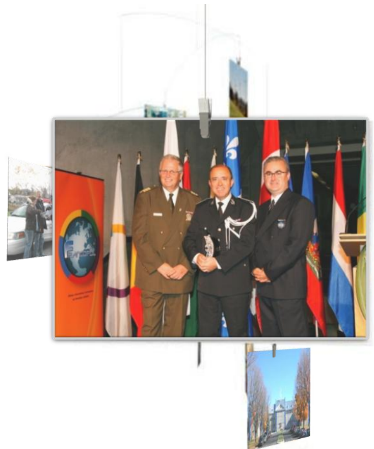
5 – CFIS : Carrefour francophone de l'information et du savoir