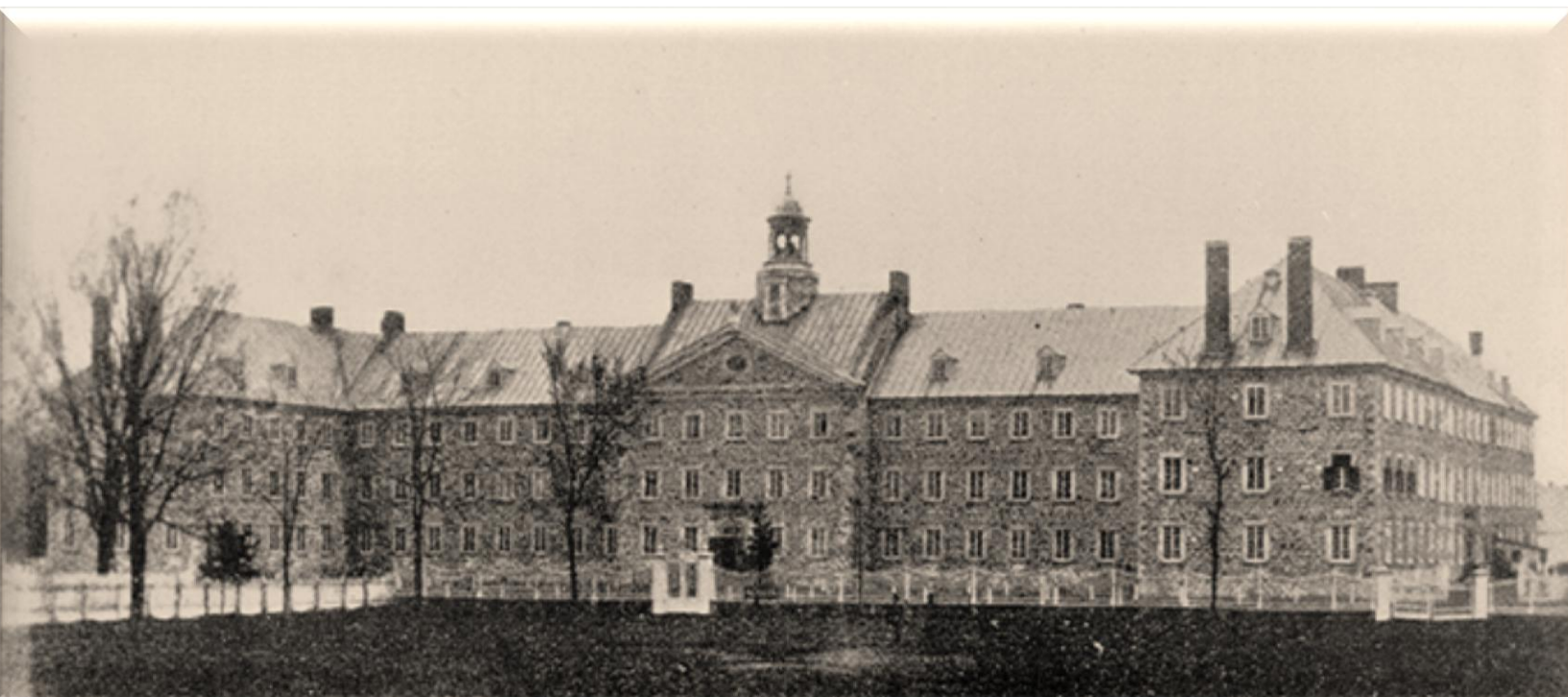
Entrée principale – Séminaire de Nicolet (1885)