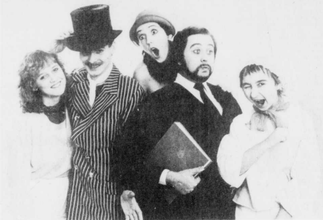
La Course des As contre les tas

A l'occasion de ce dernier Ciné-Famille avant Noël, de nombreuses surprises sont prévues. Représentation: 13h30.