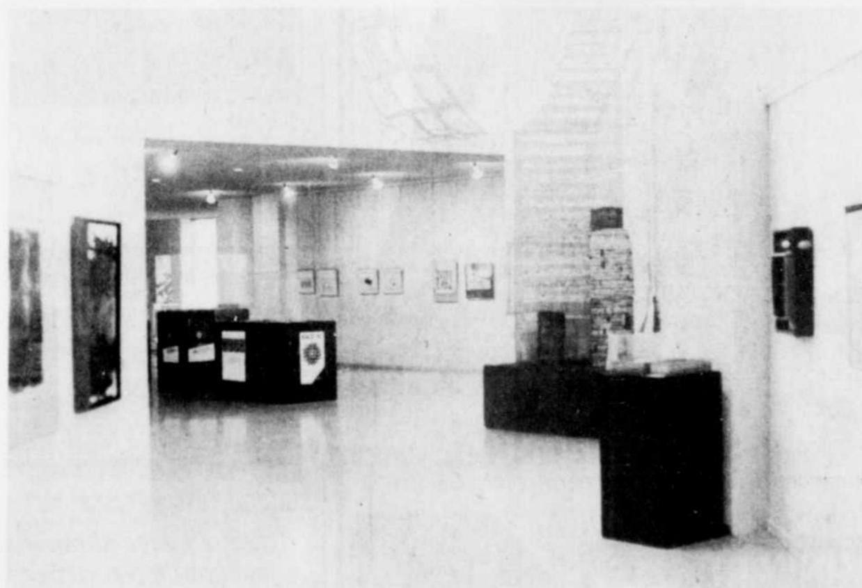
Une vue d'ensemble de l'exposition du RACE

A cette manifestation, s'ajoute une performance de Normand Achim à la Petite Salle, le 29 novembre à 20h30.