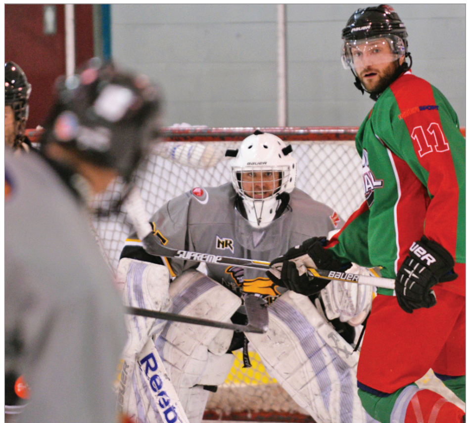
Le succès populaire obtenu par la LHÉ est certainement signe que ses activités viennent combler un besoin dans la région.

Si un comité a été institué pour chauffer la Ligue, et rattacher les quatre équipes sous un même cadre réglementaire, chacune est cependant responsable de sa propre administration. Les budgets peuvent donc différer, selon les ententes de location de glace qui peuvent différer selon les municipalités.