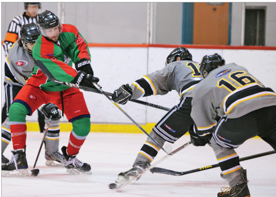
L'objectif de la Ligue est d'offrir aux hockeyeurs de la région la possibilité de poursuivre la pratique du hockey de haut calibre à leur sortie du hockey mineur.

Il est possible de suivre les activités de la LHÉ en ligne, au www.sportschaleurs.com/lhebdc/ , où l'on retrouve horaire, statistiques, nouvelles et photos.