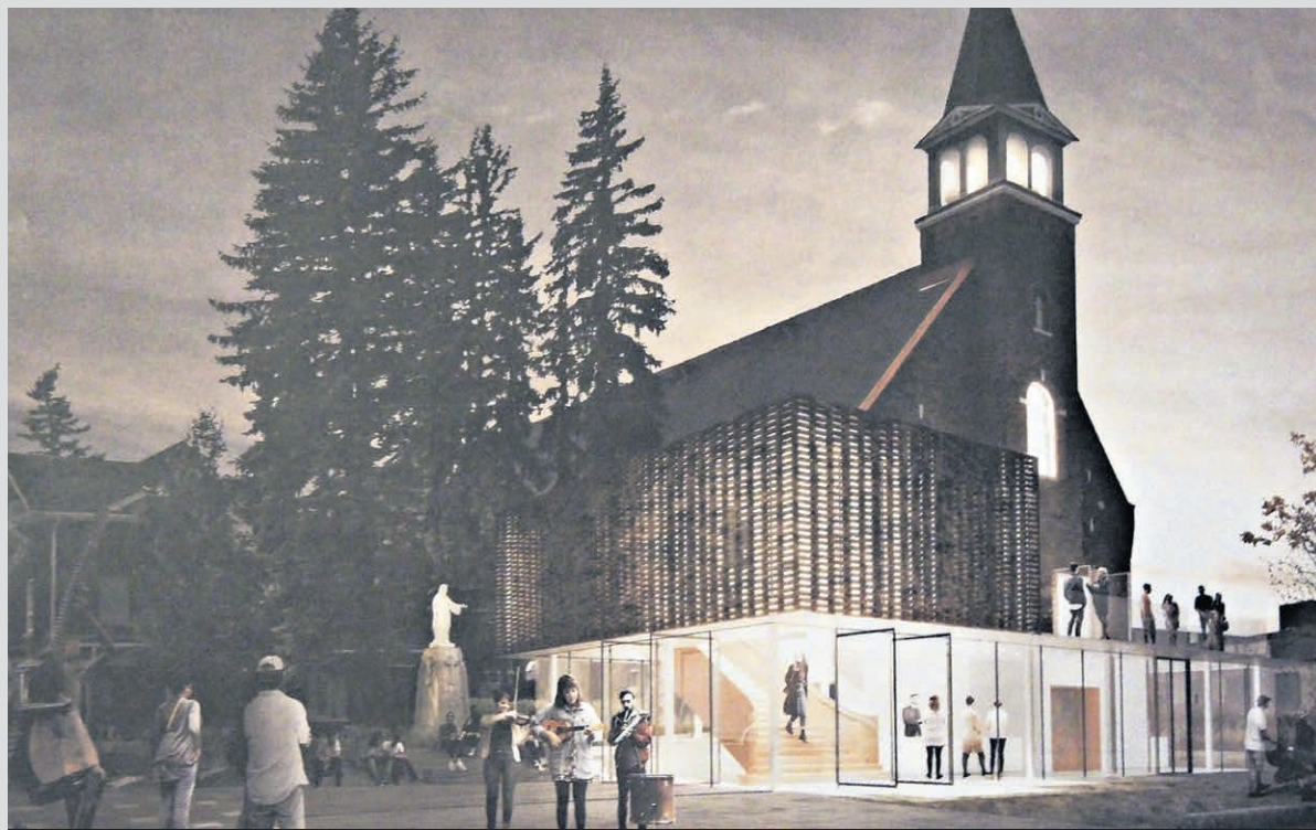
L'Agora des arts fera partie des établissements qui présenteront des activités lors de La Nuit Blanche du Vieux Noranda, qui se déroulera dans la nuit du 20 au 21 avril 2024 dans ce quartier de Rouyn-Noranda.