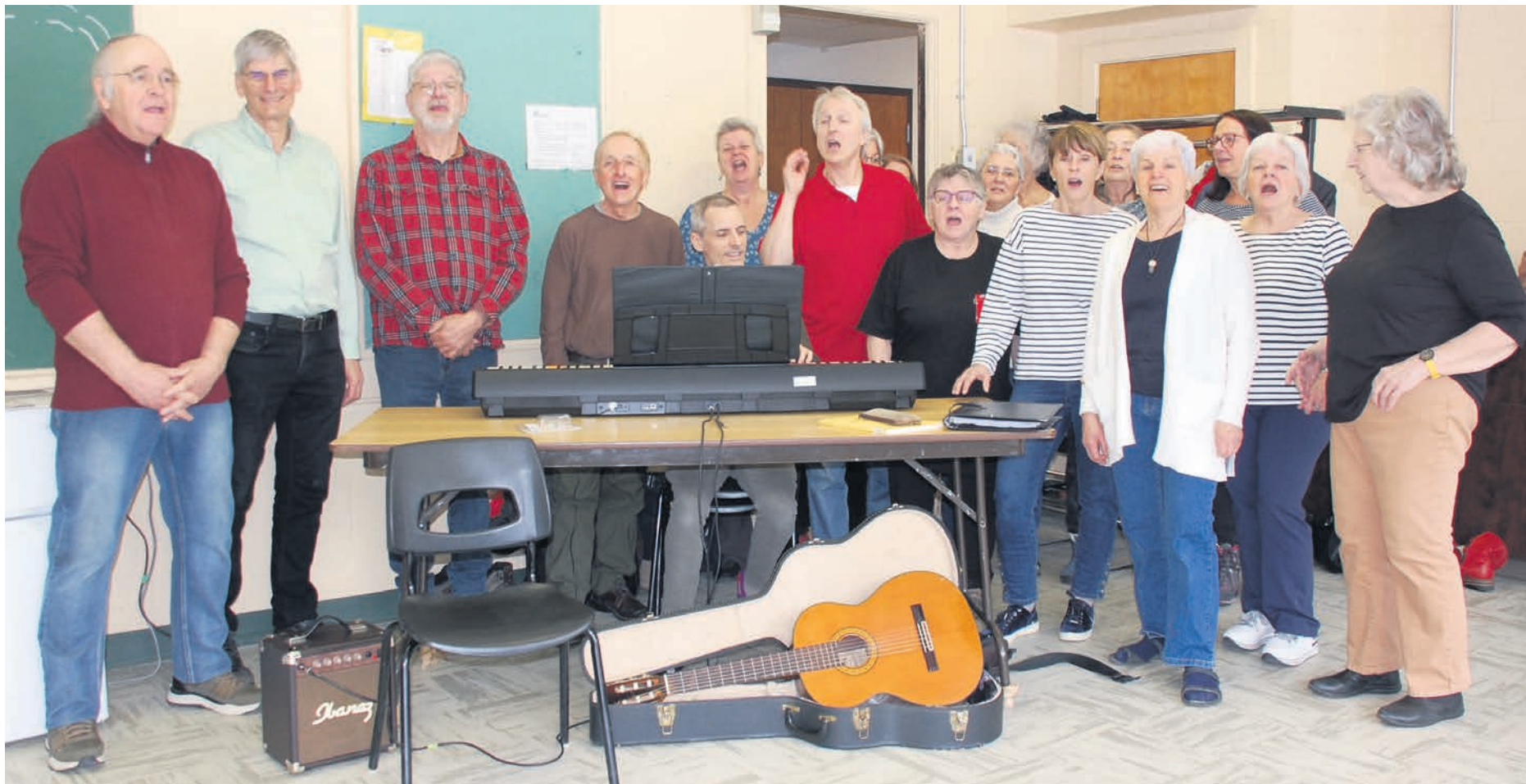
Le spectacle de clôture des célébrations du 20e anniversaire du Réseau Libre Savoir aura lieu à l'Agora des arts de Rouyn-Noranda, le 15 avril 2024, dès 13h30