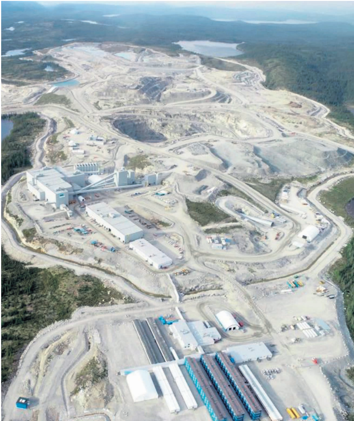
Winsome Resources entreprend des démarches afin d'acquérir, pour la somme de 52 millions de dollars, les infrastructures de l'ancienne mine de diamants Renard, propriété de Stornoway.