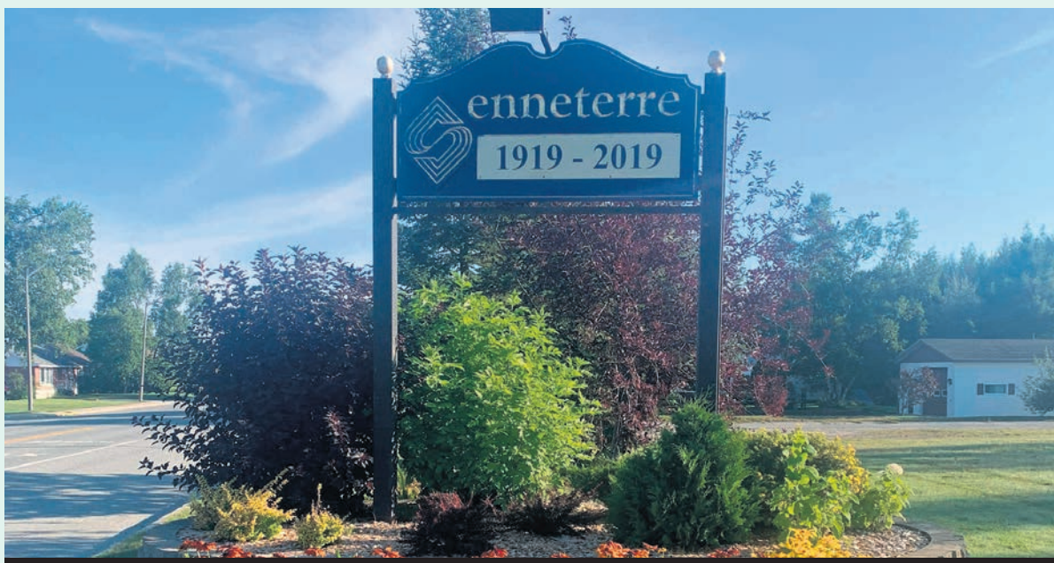
Senneterre deviendra le 47 e village-relais du Québec, et le troisième dans la région.

En incluant Senneterre, le Québec compte un grand total de 47 villages-relais dans près d'une quinzaine de régions différentes de la province.