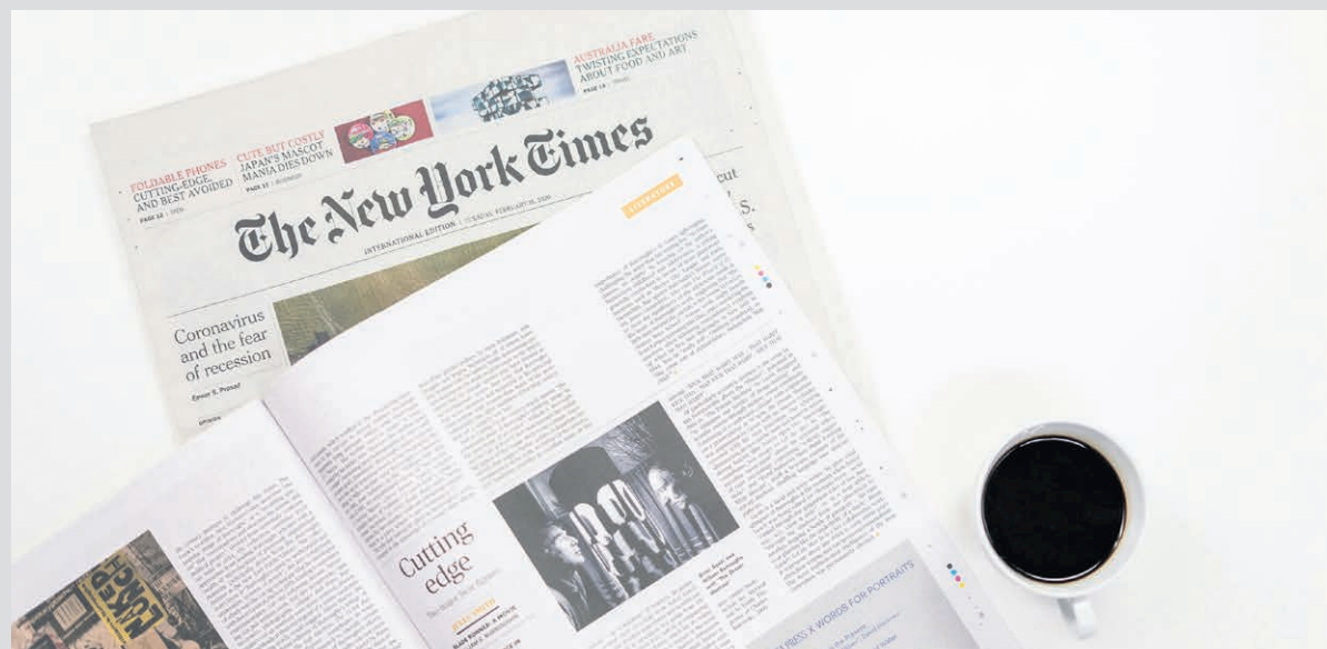
L'article du New York Times, rédigé par le journaliste affecté aux dossiers canadiens, Norimitsu Onishi, a été publié dans l'édition du 30 mars 2024.