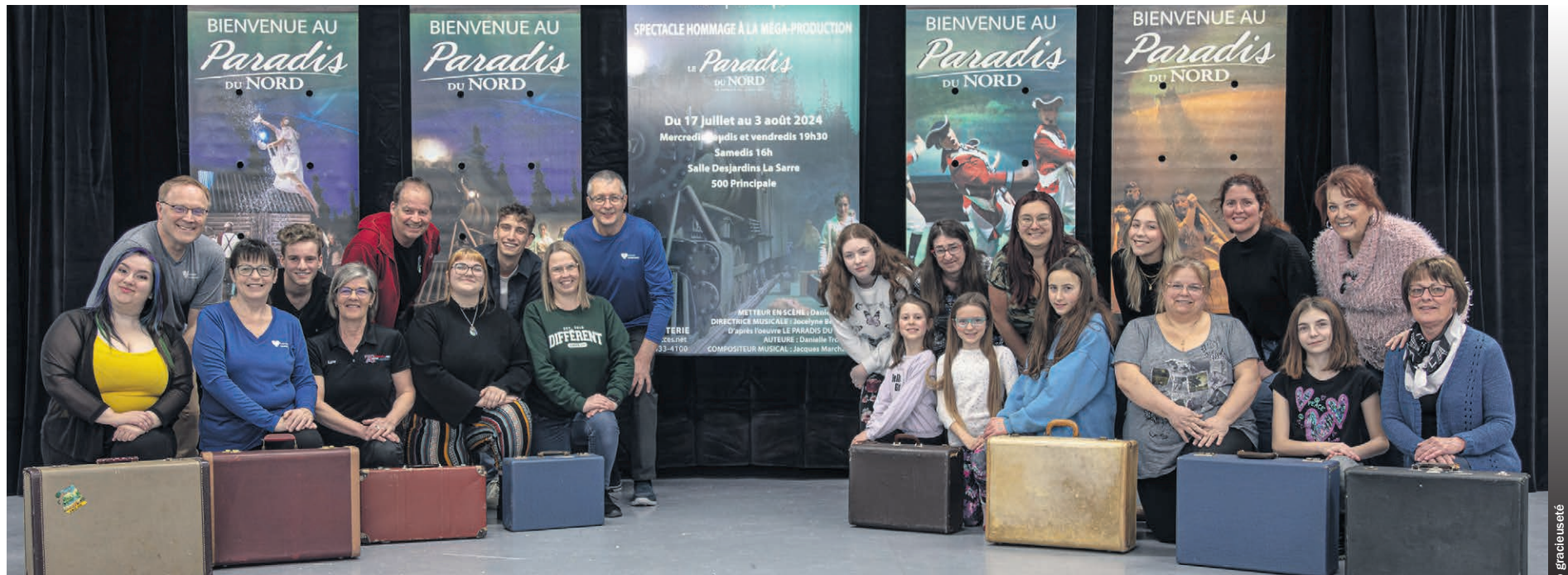
La troupe À Cœur Ouvert présentera le spectacle « Dernier embarquement au Paradis », du 17 juillet au 3 août 2024 à la salle Desjardins de La Sarre.