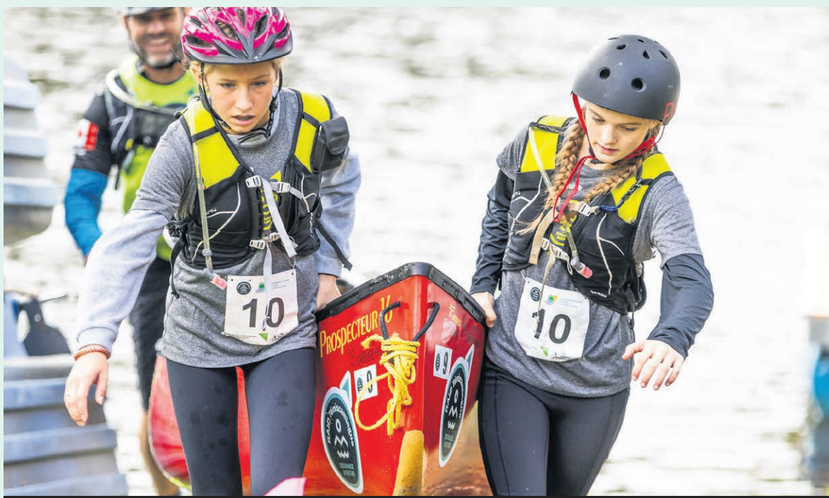
Les passionnés d'aventure et de plein air apprécient particulièrement le Raid Témiscamingue.

Aventure - Si les organisateurs et participants au Raid Témiscamingue de 2023 ont ressenti un profond sentiment du devoir accompli au terme de cette édition, ils pourront visionner en primeur au Rift de Ville-Marie le 16 avril le film qui a été tiré de l'événement.