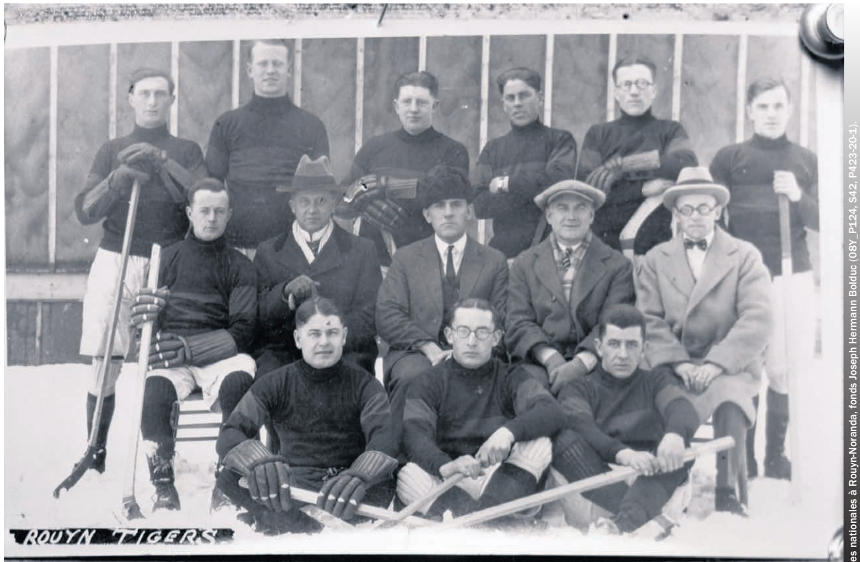
L'équipe des Tigers de Rouyn lors de la saison 1926.