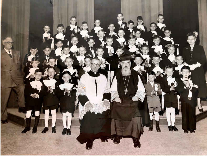
Photo de ma première communion : je suis le premier de la première rangée à gauche

Mais, à bien y penser, j'étais juste un peu en avance sur mon temps! Aujourd'hui, on peut mâcher l'hostie que le prêtre nous a mise dans notre main!