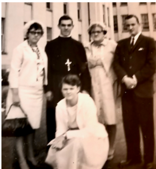
Mes premiers vœux en présence de ma famille

Moi, le petit orphelin de père, depuis l'âge de 8 ans, j'allais faire un énorme saut qui allait donner un sens à toute ma vie!