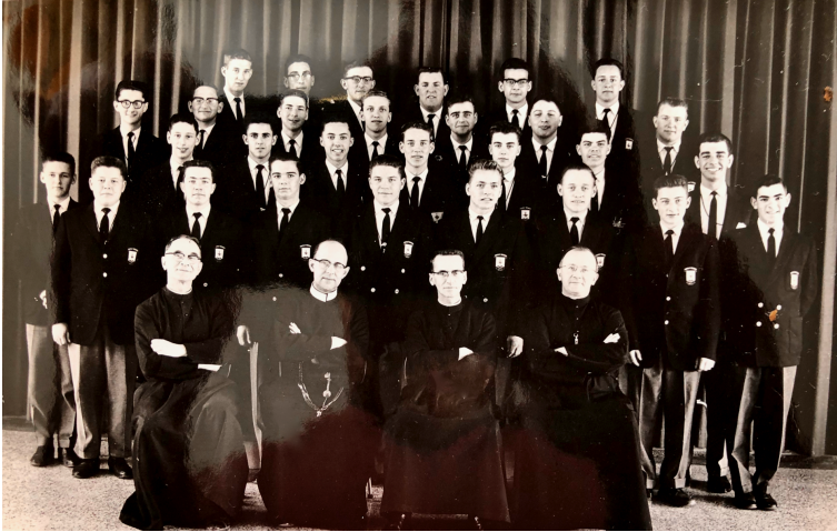
Mon groupe au postulat. Je suis le premier dans la première rangée à droite