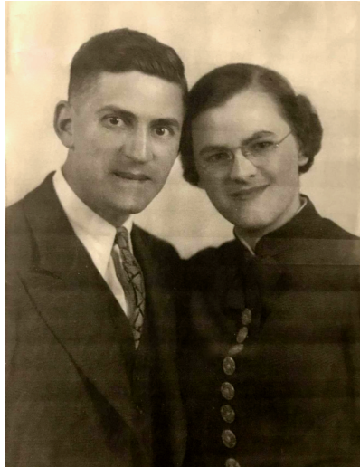
Photo de noce de mes parents