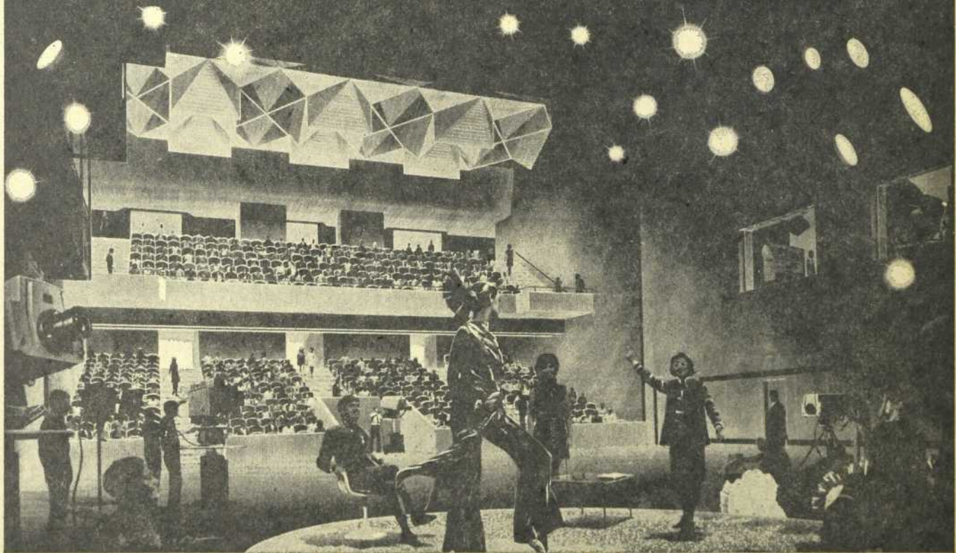
Le studio 42 de la nouvelle maison de Radio-Canada

RADIO-CANADA DE A MONTREAL COMPOSEZ 285-2690