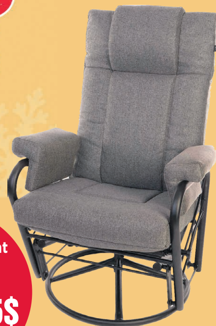
Choix de tissus *Quantité limitée

Fauteuil berçant avec dossier inclinable 699 95 $