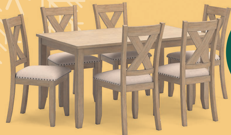
Table 36"x 60" avec 6 chaises *Quantité limitée