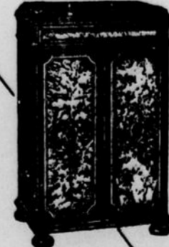
L'ELECTRAPHON Radio et phonographe combinés fonctionnant à l'électricité