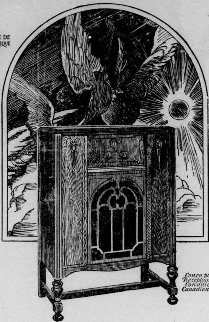
CHEF-D'OEUVRE DE GENIE RADIOPHONIQUE MARCONI