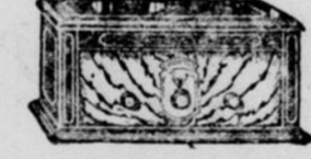
Modèle C-53 A batteries seulement.