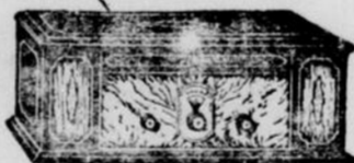
Modèle E. 54