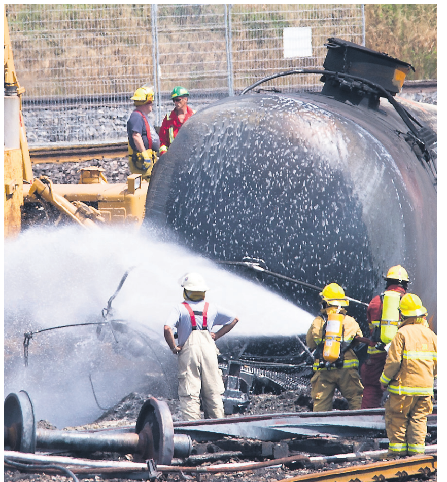
Des pompiers aspergent encore de la mousse ignifugeante sur le lieu de l'explosion.