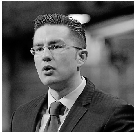
Les députés conservateurs Pierre Poilievre, Shelly Glover et Chris Alexander sont trois des nouveaux visages qui pourraient faire leur entrée au Conseil des ministres dès ce matin.

Les spéculations vont bon train pour savoir quels politiciens conservateurs se verront maintenant confier les plus hautes responsabilités en cette période de mi-mandat mar-