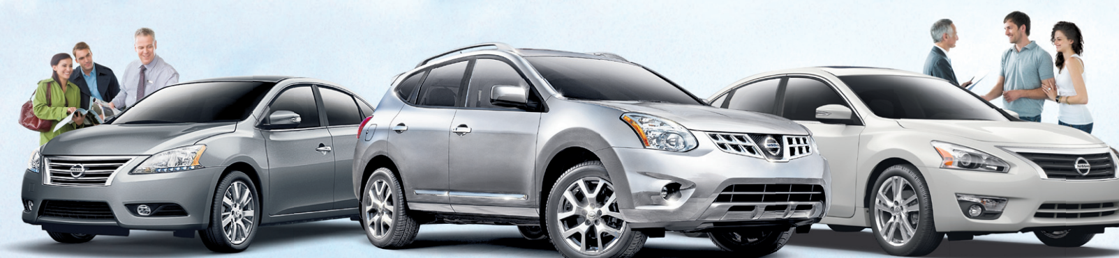
Sentra 1.8 SL 2013 illustrée