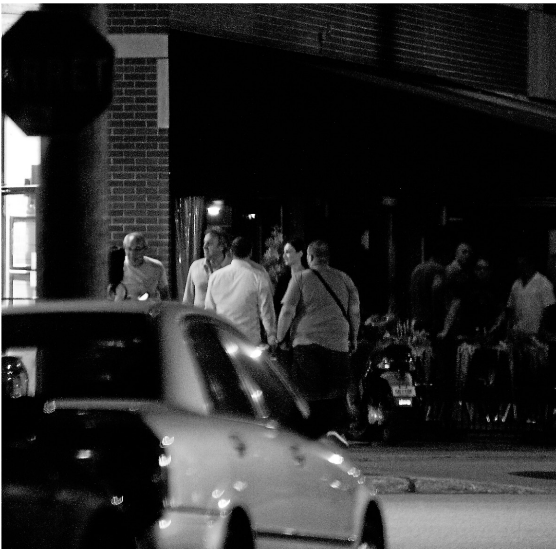
Vito Rizzuto a été aperçu le 4 juillet la terrasse d'un restaurant rue Laurier Ouest, dans le Plateau Mont-Royal.