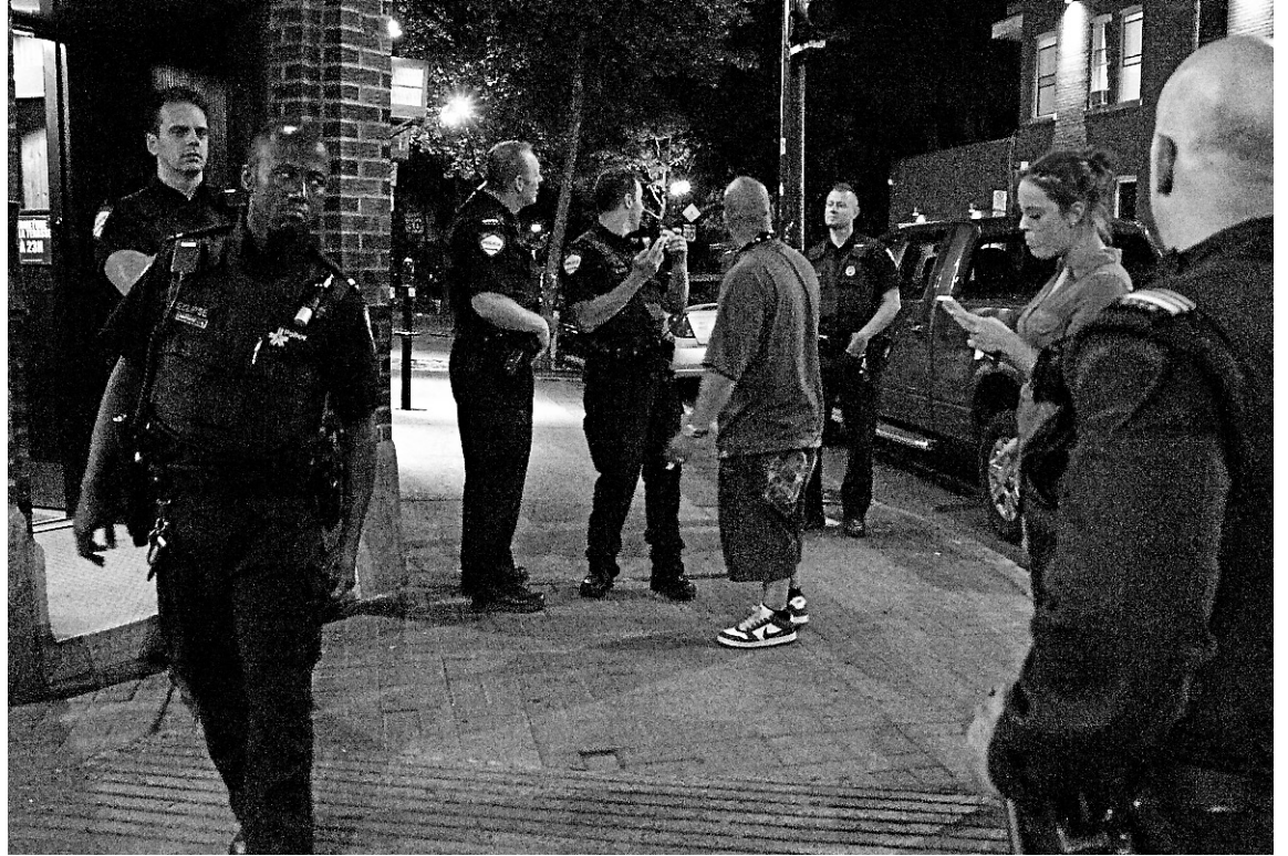
L'escouade intervient en force dans un bar de la rue Ontario, dans le quartier Hochelaga-Maisonneuve.