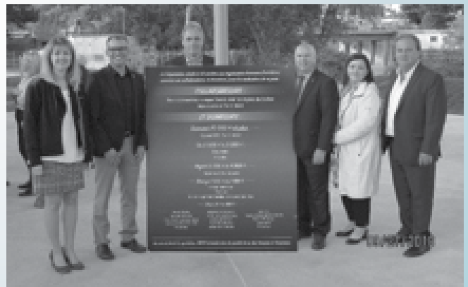
Inauguration du Parc du Pont le 27 septembre 2018