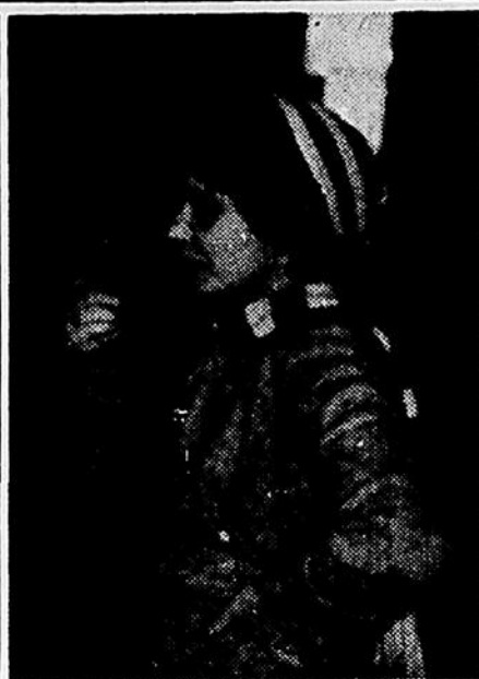
A la Société Artistique: après les barbus, les demi-barbus et les imberbes, les femmes à pipe. "The show must go on."

Accuser fausement et publiquement un adversaire d'être communiste, de dire la revue, est une faute grave contre la vérité, une faute contre la véracité, car on induit en erreur un nombre plus ou moins grand d'auditeurs ou de lecteurs. Et dire que dernièrement un professeur agrégé