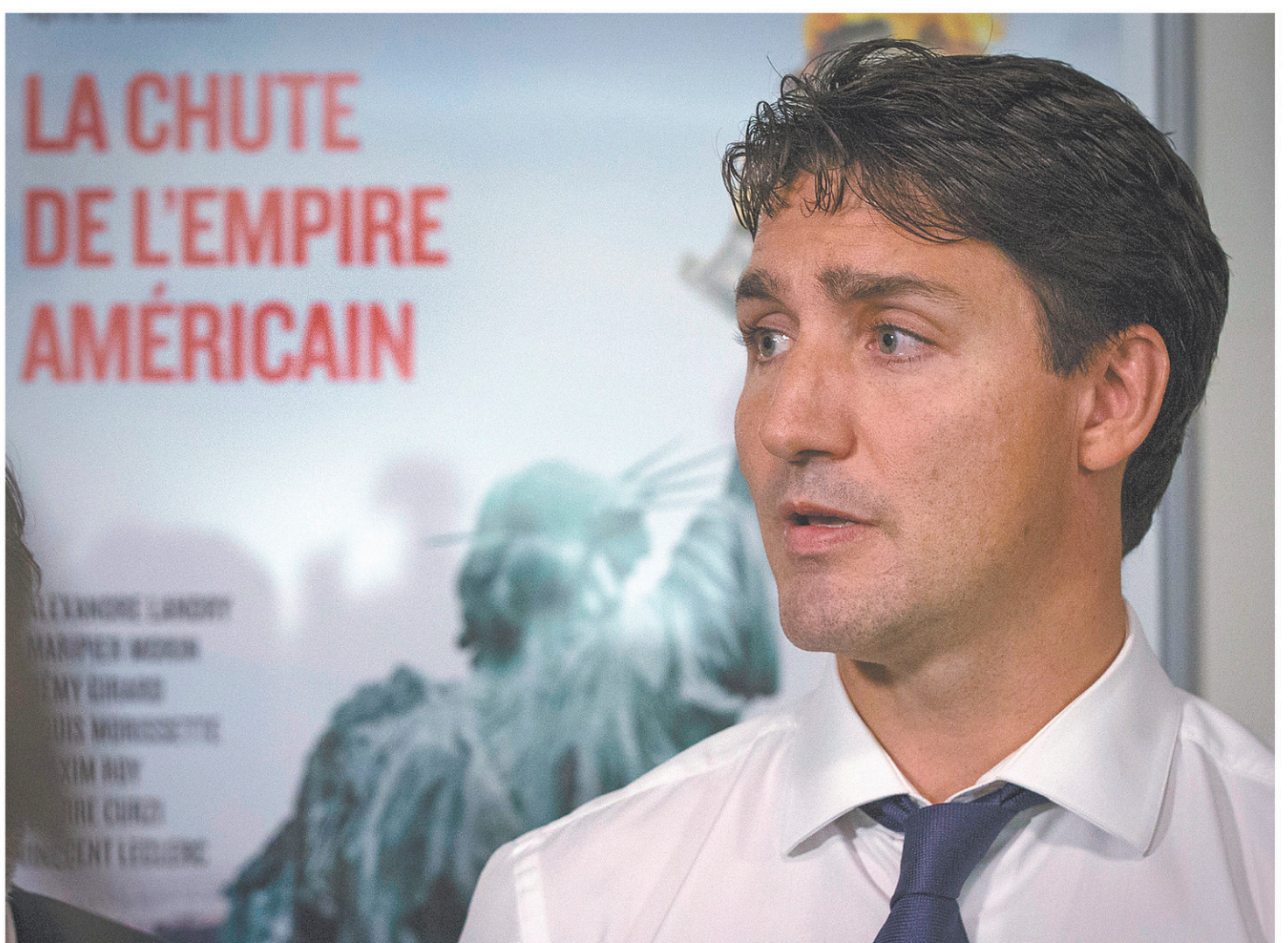
Le premier ministre Justin Trudeau s'est adressé aux médias au cours d'une viste des bureaux de Films Séville, à Montréal.

Québec avait annoncé en juin une enveloppe de 100 millions en prêts et garanties de prêts — par l'entremise du programme Essor — afin d'épauler les petites et moyennes entreprises affectées par cette salve commerciale du gouvernement Trump. Plus de 1400 entreprises œuvrent dans le domaine de la transformation de l'aluminium dans la province. Elles génèrent une partie des 10 000 emplois directs et 20 000 autres postes indirects rattachés à l'industrie du métal gris.