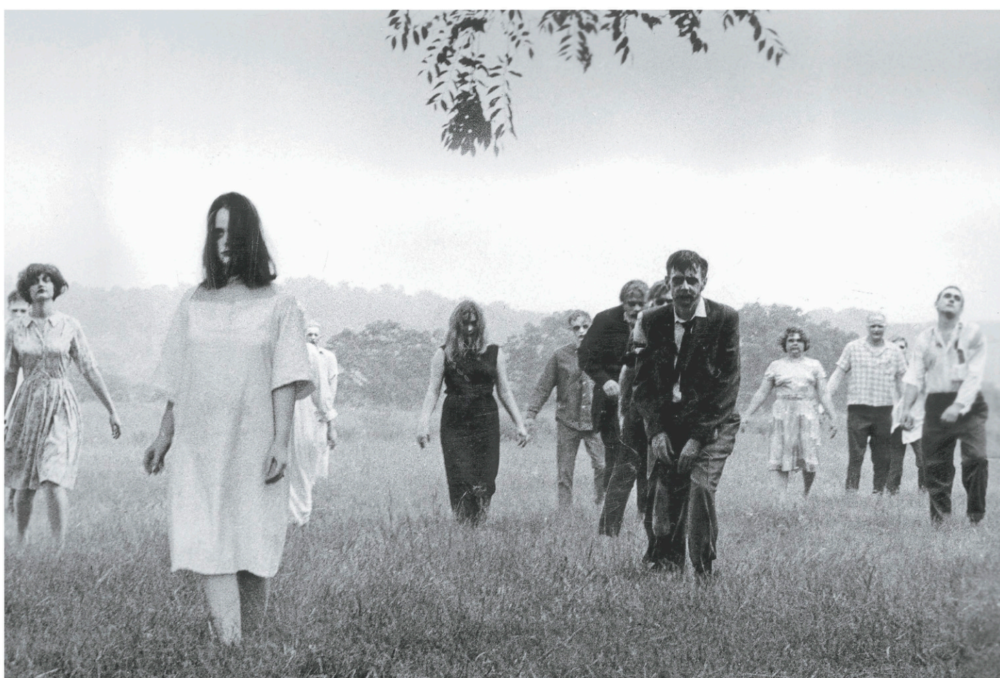
Lorsque La nuit des morts-vivants prit l'affiche dans les cinémas et ciné-parcs américains en octobre 1968, George A. Romero ne se doutait pas de la valeur sociopolitique qu'on accolerait à son premier film.

Traumatisée, la jeune femme trouve refuge dans la ferme mentionnée, où la recueille Ben. En pleine stupeur, Barbara n'est qu'à demi-consciente de ce que Ben les barricade tous deux dans la maison désertée tandis que, de loin en