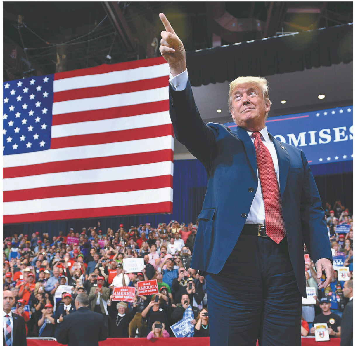
Donald Trump ferait mieux de regarder par deux fois son prétendu succès de l'AEUMC, a réagi cette semaine The Economist . Selon la revue britannique, il a tout au mieux « résolu une crise qu'il avait lui-même créée ».

Donald Trump ferait mieux de regarder par deux fois son prétendu succès de l'AEUMC, a réagi cette semaine The Economist . Selon la revue britannique, le président a tout au mieux « résolu