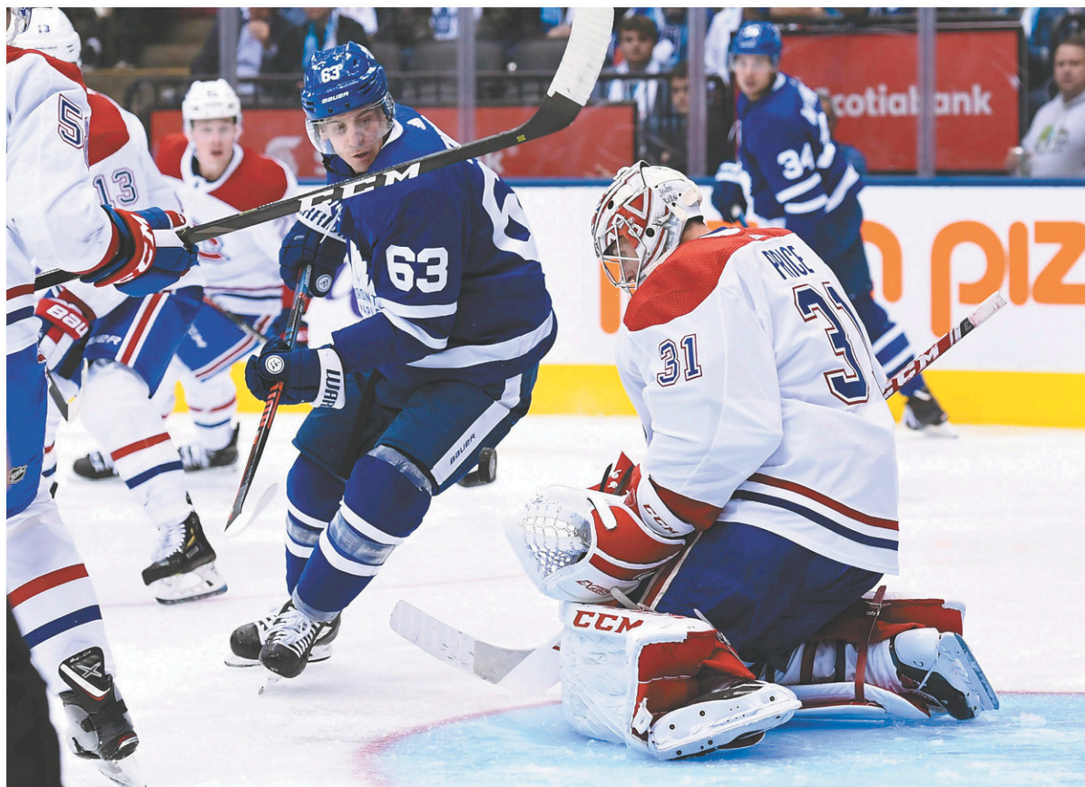
Carey Price s'est dressé à plusieurs occasions contre la puissante attaque des Maple Leafs, mercredi, notamment devant l'attaquant Tyler Ennis.

Dans le cas de Matthews, ça commence à être une habitude. Lors de ses quatre derniers matchs face à Price, l'Américain de 21 ans n'a inscrit rien de moins que sept buts à l'aide de seulement 15 tirs.