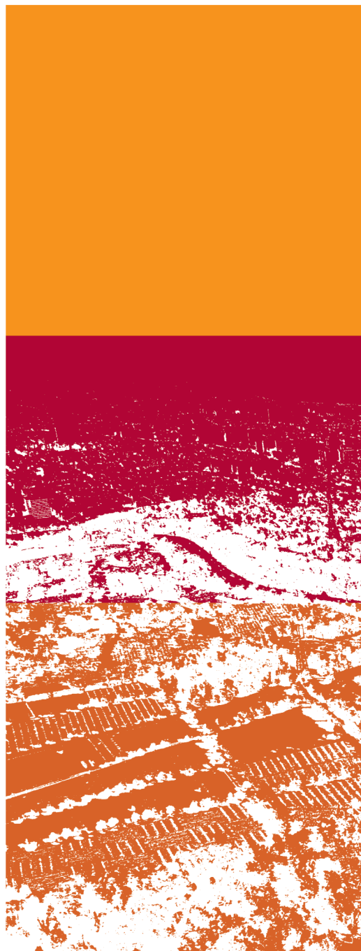
Conception graphique : Caroline Marcant, zigomatik.ca

Téléphone : 514 872-3911 Télécopieur : 514 872-1505 eve_publics@ville.montreal.qc.ca ville.montreal.qc.ca/evenementspublics