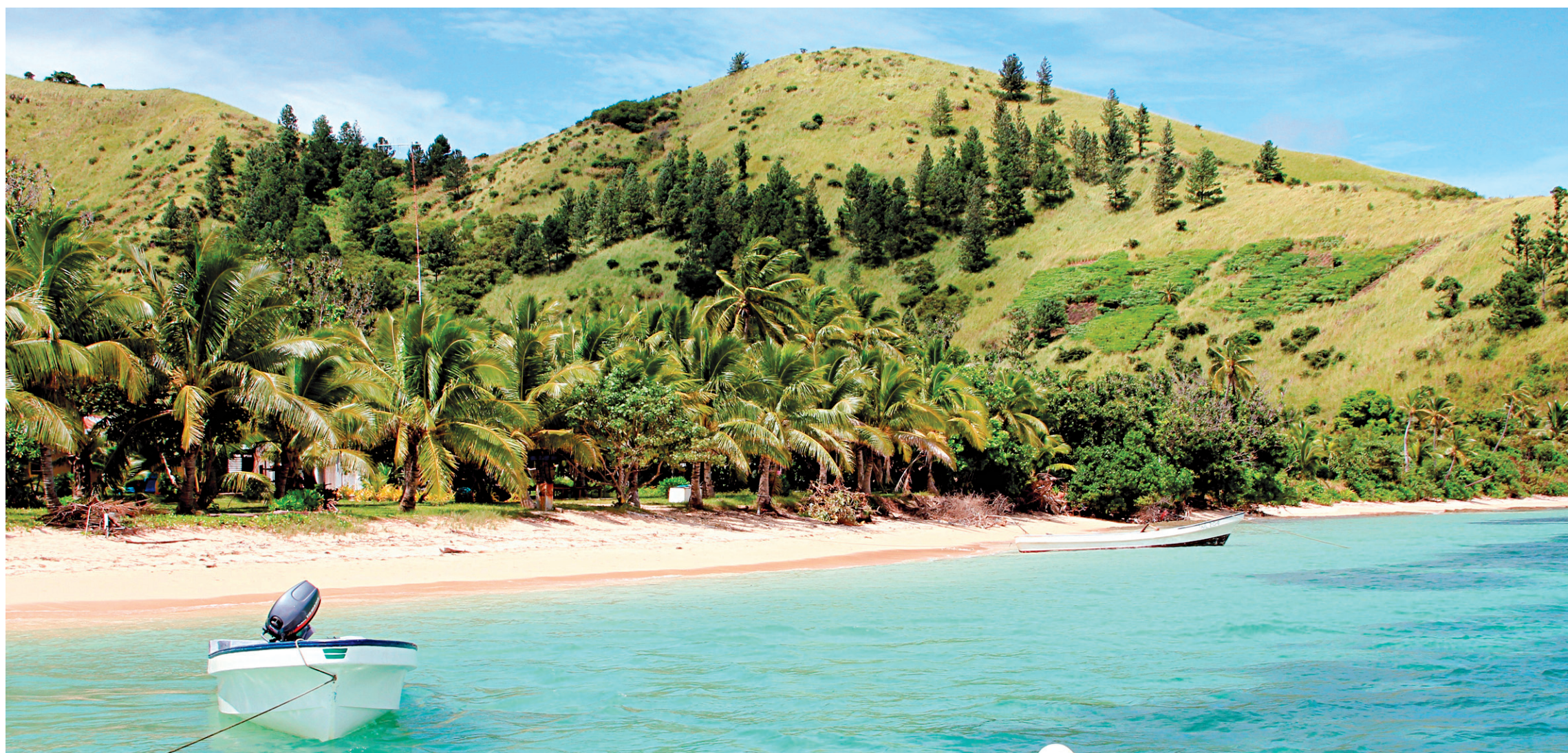
Escale au village de Tavua, dans l'île des Mamanuca.