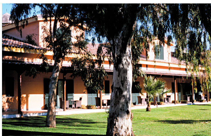
À la Bruca, les anciennes écuries ont été transformées en appartements à louer.

Avant, ici, on produisait surtout du tabac et des légumes. Il existait aussi un club hippique célèbre. Le propriétaire, qui habite encore sur les lieux, a fait restaurer les bâtisses de la ferme en créant un cadre raffiné qui préserve leur authenticité. Depuis 2008, l'étable abrite dix chambres, l'écurie et la grange, des appartements à louer. Une grande piscine et des courts de tennis ont été ajoutés, on organise des activités équestres autour