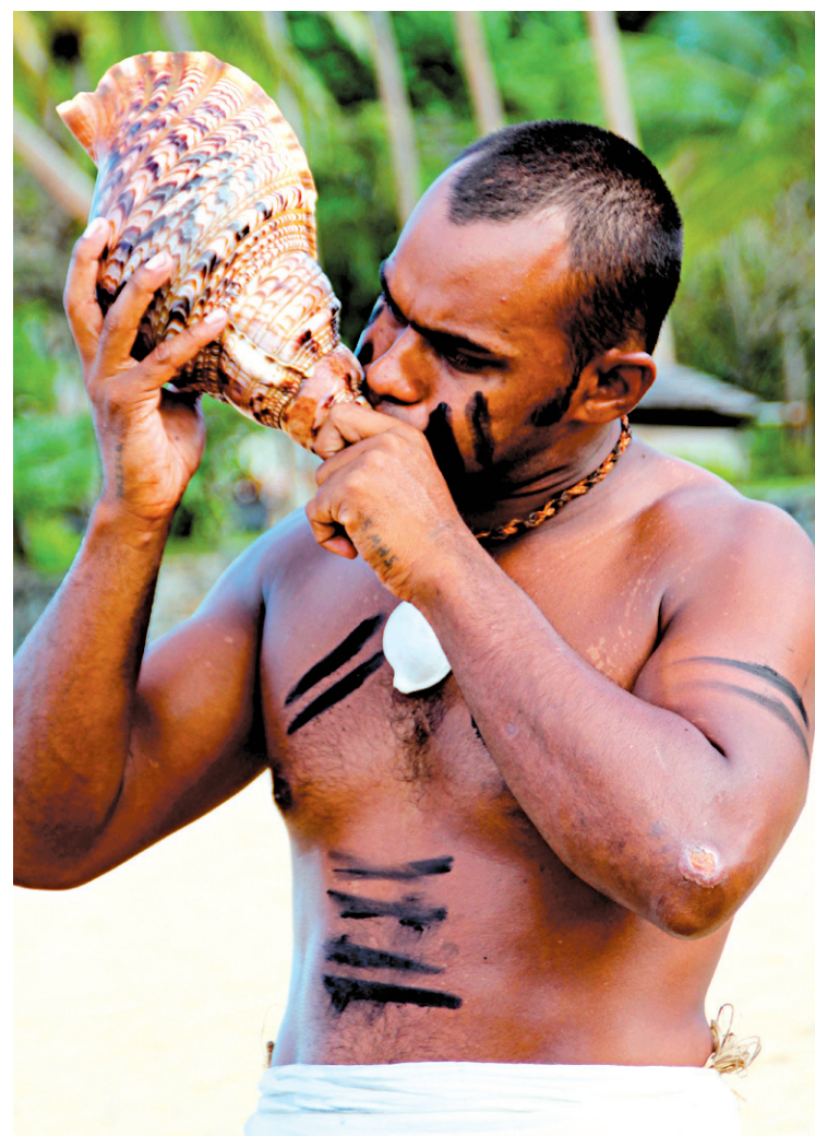
Un clin d'œil fidjien au temps d'avant le cellulaire!

Saviez-vous que c'est principalement aux Fidji que les fournisseurs de matériel d'aquarium s'approvisionnent en roches vivantes, utiles pour l'épuration des bacs? Moi non plus! Pour les villageois, c'est un commerce lucratif. Lennui, c'est que, une fois que ces roches ont été prélevées, la vie marine s'éteint. Pour les valoriser, les propriétaires de l'hôtel