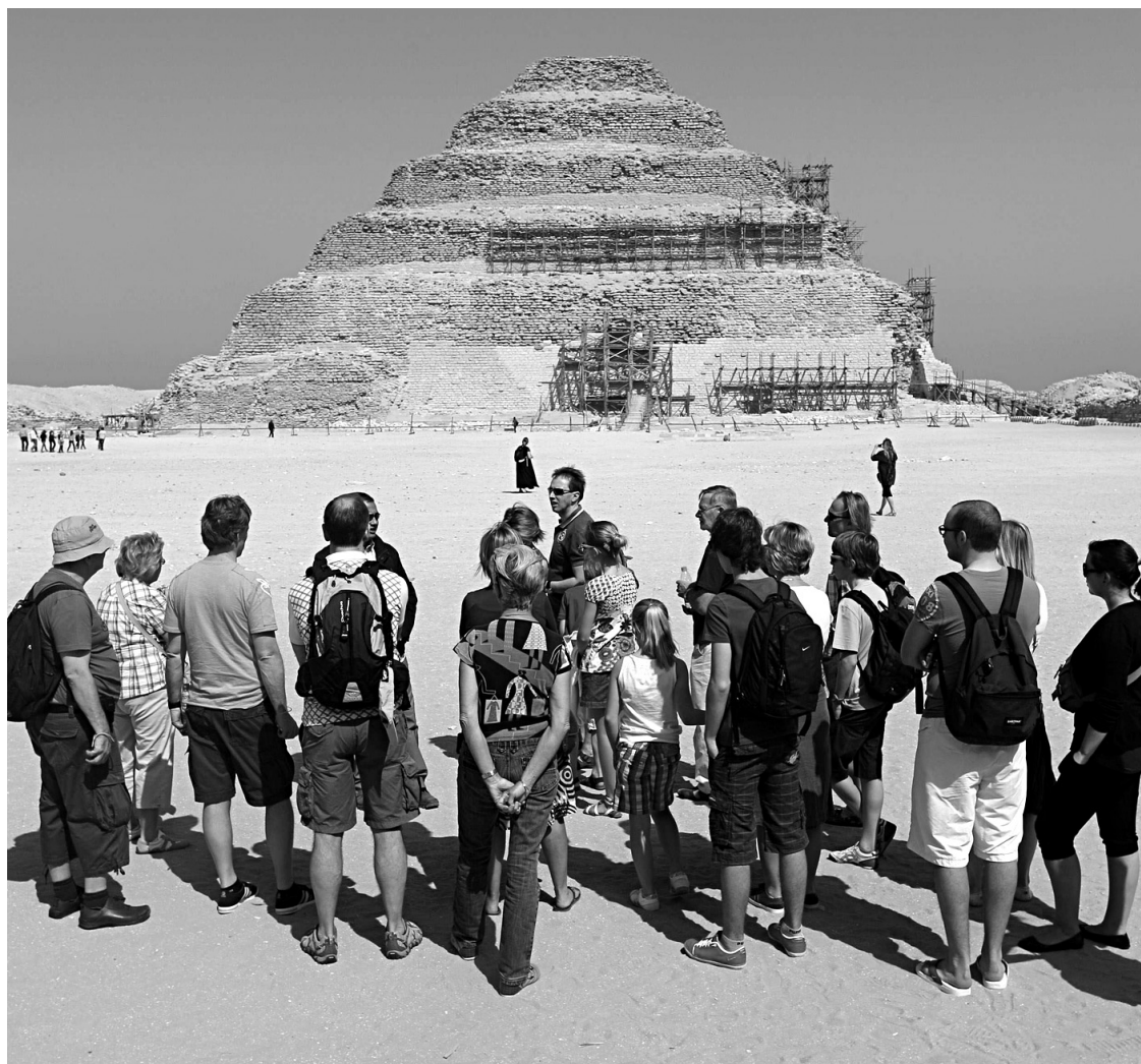
Groupe de touristes devant la nécropole de Saqqara en Égypte. Des lecteurs ayant participé à une formule de voyage «semi-organisé» nous informent qu'il leur en a coûté autant qu'un voyage de groupe traditionnel, soit environ 5000 $ par personne, l'avion compris. En outre, ce voyage ne leur a pas laissé la liberté qu'ils espéraient.

«En réponse à la demande de M. Villeneuve de Gatineau pour un guide francophone à Venise, je lui suggère de se rendre à l'adresse électronique suivante: www.e-venise.com . Je crois qu'en communiquant