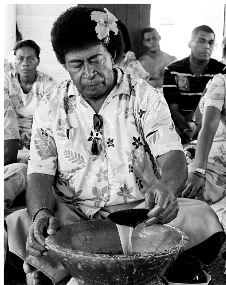
Le chef du village de Lawai prépare le yaqona, un rituel des plus sérieux.