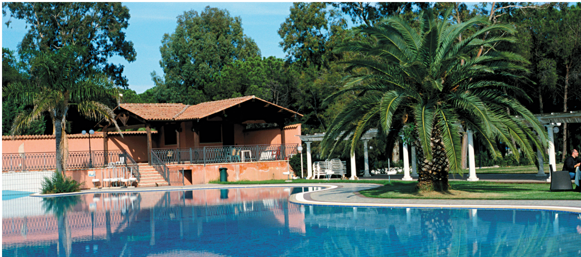
La splendide piscine en forme de Calabre, qui étend 800 m 2 de bleu turquoise au milieu du parc.

Entre la plage, la dégustation de spécialités locales, dont de sublimes pâtes fraîches faites avec amour par la maman de Natale et servies au bord de la piscine, les excursions culturelles ou sportives organisées sur place, l'apéritif du soir au milieu des fleurs, tout est fait pour se détendre dans un cadre splendide.