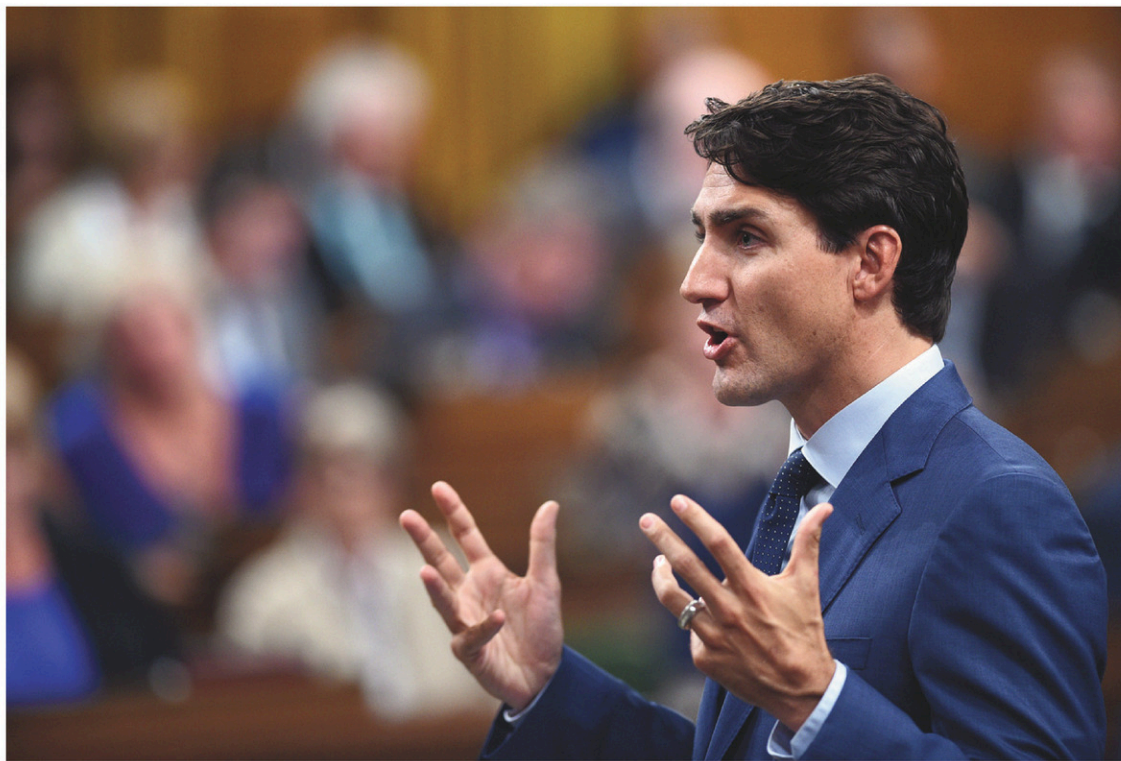
Le premier ministre, Justin Trudeau, à la période des questions, lundi

Alors que plusieurs associations médicales professionnelles menaient une campagne publique bien ficelée pour dénoncer les changements « injustes » du gouver-