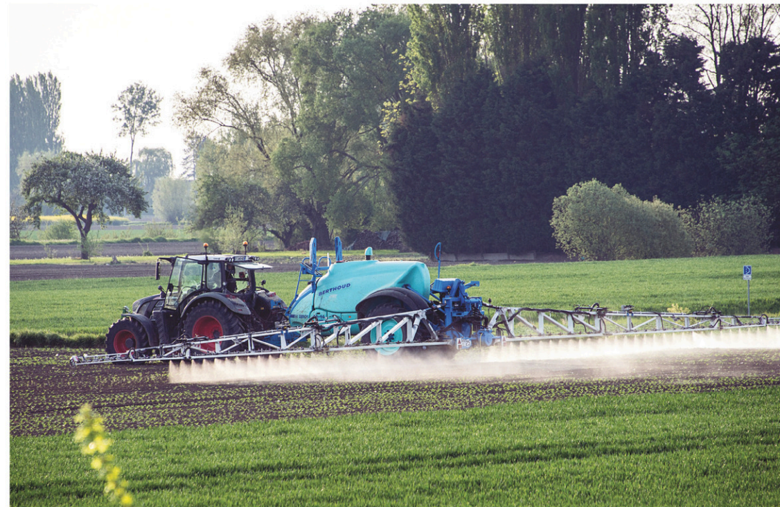
DENIS CHARLET AGENCE FRANCE-PRESSE

Cette catégorie de pesticides a été détectée à grande échelle dans l'environnement partout dans le monde, et notamment au Canada. Sa présence est généralisée dans les rivières des zones agricoles du Québec depuis au moins 2011. En 2015 et 2016, des néonicotinoïdes ont été détectés dans 100% des échantillons prélevés, a indiqué au Devoir le ministère du Développement durable, de l'Environnement et de la Lutte contre les changements climatiques (MDDELCC). Les taux observés dans les rivières en milieu agricole dépassent les normes dans une forte proportion. Un échantillon affi-