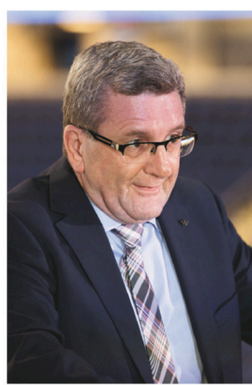
Le maire Régis Labeaume

À quatre jours du déclenchement de la campagne,