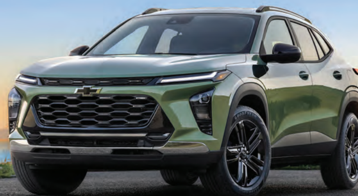
Chevrolet Trax 2025

10 en inventaire 0% d'intérêt sur 60 mois jusqu'à 1660 $ de rabais Démonstrateurs disponibles