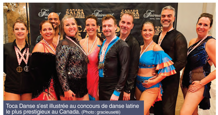
Toca Danse s'est illustrée au concours de danse latine le plus prestigieux au Canada.

Un autre moment fort du congrès a été la présentation de la troupe Bachata Expectation dans le cadre du Emerging Artists Showcase , un spectacle mettant en lumière la relève.