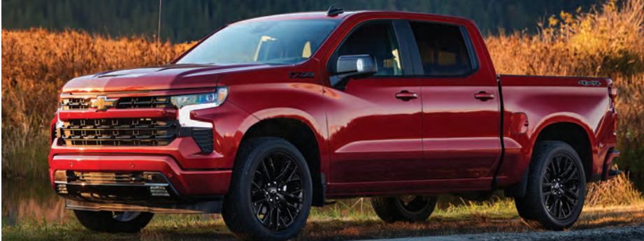
Chevrolet Silverado 1500 2025

9 en inventaire 0% d'intérêt sur 84 mois jusqu'à 8250 $ de rabais Démonstrateurs disponibles