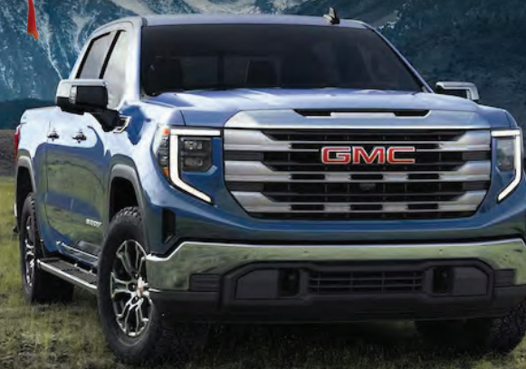
GMC Sierra 1500 2025

9 en inventaire 0% d'intérêt sur 84 mois jusqu'à 8110 $ de rabais Démonstrateurs disponibles