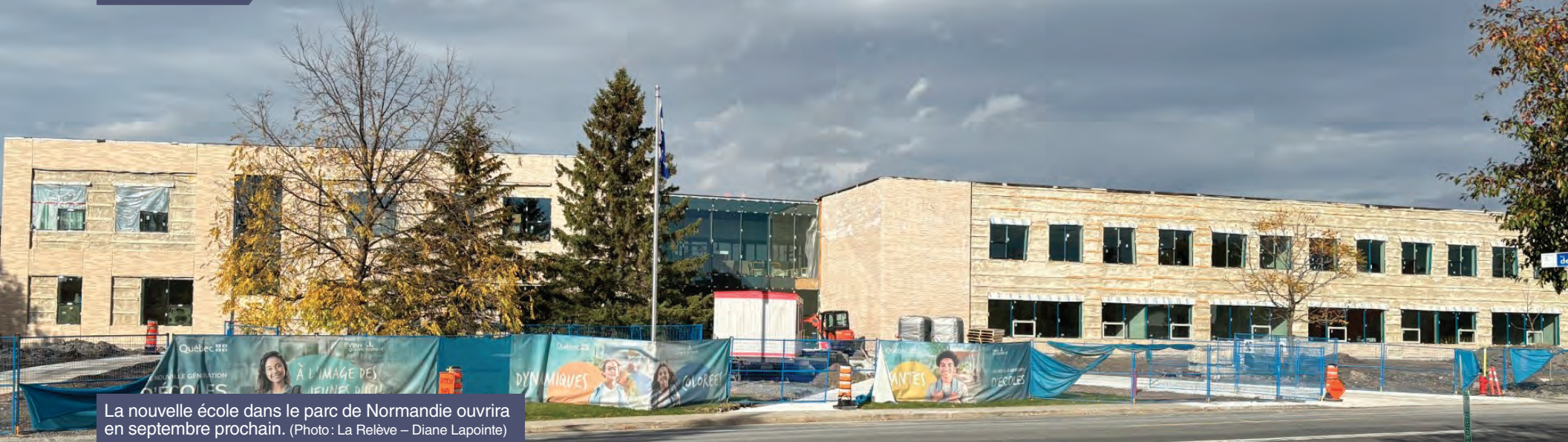
La nouvelle école dans le parc de Normandie ouvrira en septembre prochain.