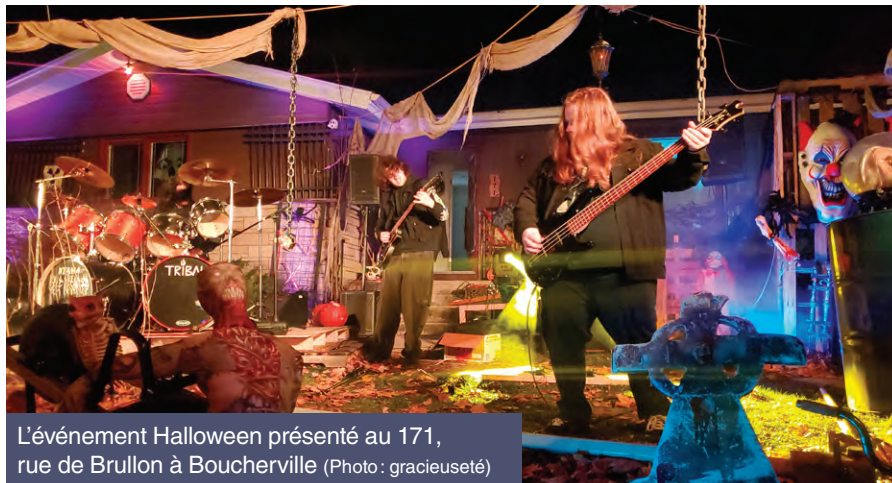
L'événement Halloween présenté au 171, rue de Brullon à Boucherville

Voici donc deux lieux incontournables à visiter le soir du 31 octobre où musique et créativité contribuent à créer une atmosphère aussi effrayante que conviviale.