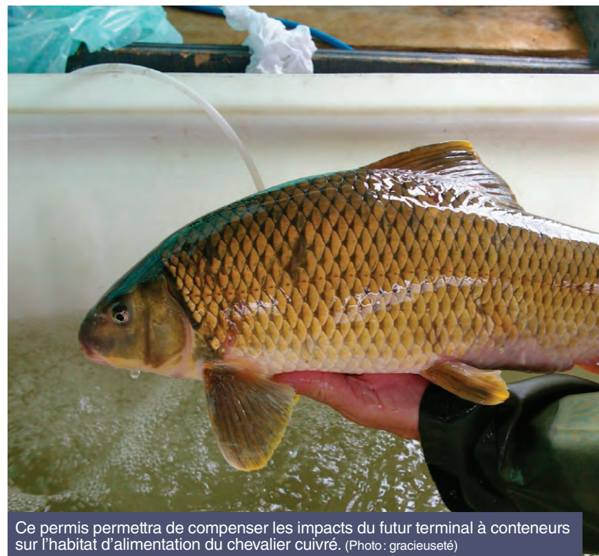
Ce permis permettra de compenser les impacts du futur terminal à conteneurs sur l'habitat d'alimentation du chevalier cuivré.

DANIEL BASTIN // DBASTIN@GRAVITEMEDIA.COM