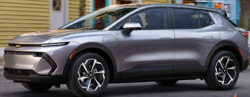
Chevrolet Equinox EV 2025

27 en inventaire 0% d'intérêt sur 84 mois 2500 $ de rabais 4000 $ en subventions