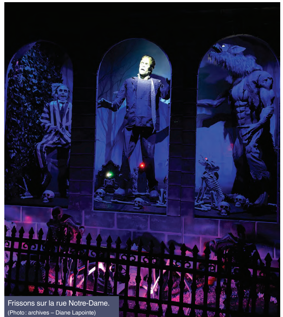
Frissons sur la rue Notre-Dame.