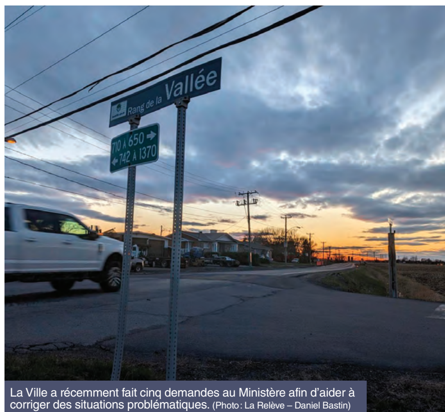
La Ville a récemment fait cinq demandes au Ministère afin d'aider à corriger des situations problématiques.

Finalement, les élus ont demandé au MTMD de procéder à la réévaluation de l'intersection formée par le chemin de Touraine et le chemin du Fer-à-Cheval et de proposer des mesures visant à faciliter et à sécuriser les manœuvres de virages à cet endroit.