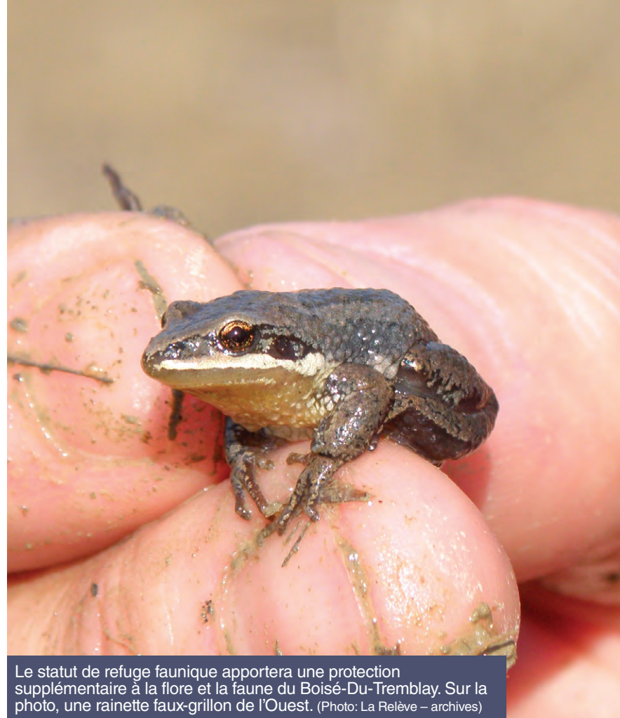
Le statut de refuge faunique apportera une protection supplémentaire à la flore et la faune du Boisé-Du-Tremblay. Sur la photo, une rainette faux-grillon de l'Ouest.

Ce n'est pas la première fois que Longueuil demande un changement de statut pour le Boisé-Du-Tremblay. Une telle demande a été effectuée en 2017 sous l'administration de la mairesse Caroline St-Hilaire.