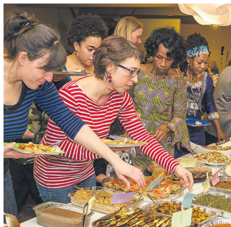
Trois activités de rencontres se dérouleront lors de cette semaine dans la MRC du Rocher-Percé.