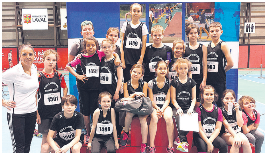
Voici tous les athlètes qui ont représenté L'École d'athlétisme de Grande Rivière à cette compétition provinciale.

Pour de plus amples renseignements, veuillez communiquer avec Mme Paradis au 418 398 9808.