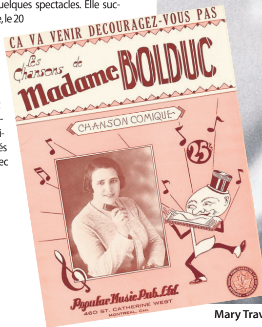
Mary Travers, une des premières artistes de la chanson populaire au Québec.

février 1941, à 46 ans. Elle repose maintenant au Cimetière Notre-Dame-des-Neiges de Montréal qui est un cimetière où plusieurs autres célébrités et personnalités connues du Québec sont enterrées. (Source: Bibliothèque et Archives Canada)