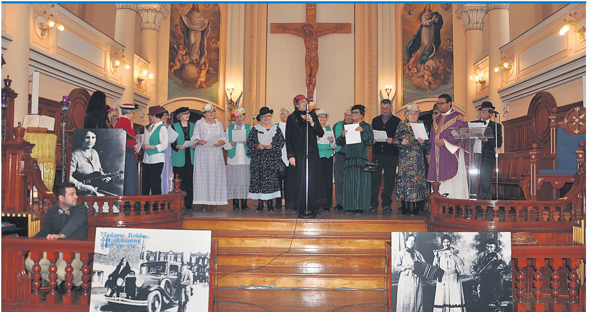
Plusieurs photos de Madame Bolduc étaient disposées à l'avant de l'église. Après la messe, plusieurs membres de la chorale ont repris la chanson « La Gaspésienne pure laine » de La Bolduc.