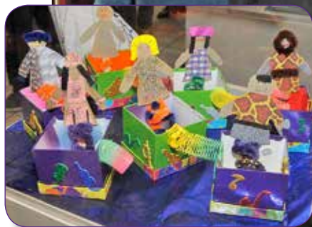
Ateliers multidisciplinaires pour enfants / Multidisciplinary children's workshops

L'exposition annuelle des enfants inscrits aux ateliers multidisciplinaires de la Direction de la culture, des sports, des loisirs et du développement social est certainement l'une des plus appréciées. Lors de la dernière, plus de 120 jeunes participants ont exposé leurs réalisations colorées au Centre des loisirs.