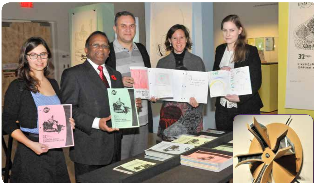
Peut mieux faire – Cahiers d'exercices