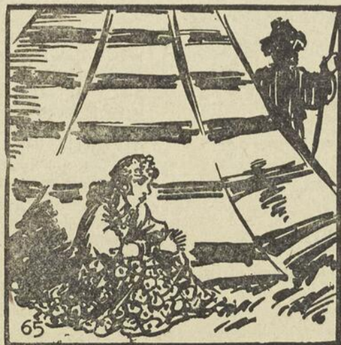
1—Les soldats d'Ivan Ogareff s'arrêtèrent aux avant-postes du camp. Ils avaient entraîné à leur suite, une foule de mendiants, de marchands, de bohémiens, qui, forment habituellement l'arrière-garde d'une armée en marche.

Adaptation et illustrations de Vincent-Fumet