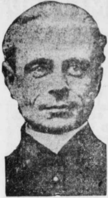
Le philanthrope américain léguaire du Carême à Notre-Dame de Montréal, donne la somme de $20,000,000