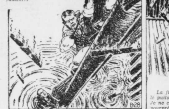
La fille semblait terrifiée en regardant dans le puits, tandis que le feu faisait rage en haut. Je ne cessai de regarder cette jolie figure empourprée, et ses yeux, fixés sur les miens, semblaient craindre terriblement pour mon sort!