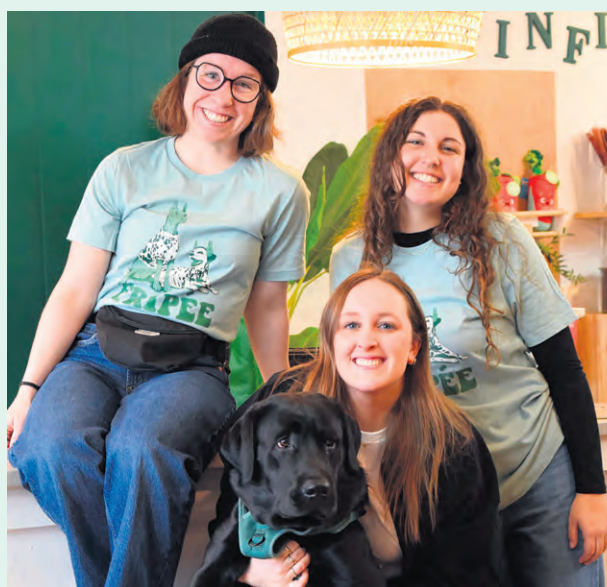
Des membres de l'équipe du CSAR à la boutique de seconde main Fripée.

Les deux fondateurs de Fripée se sont d'ailleurs inspirés du modèle établi par la Société protectrice des animaux (SPCA) de la Nouvelle-Écosse qui fonctionne