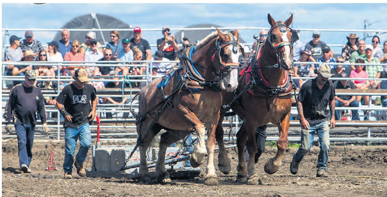
Photo Facebook - Festival Country Western De St-Gabriel-De-Rimouski - crédit: Alain Villatte Harfang Studio Multimedia

Pour l'occasion, le centre polyvalent deviendra la Countrythèque FLO 96,5 pour le plaisir de tous les amateurs de danse en ligne.