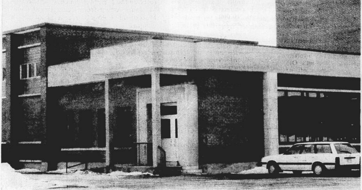
L'ajout d'espace à l'école Notre-Dame à Huntingdon se veut une demande persistante de la part de la Commission scolaire de Huntingdon.