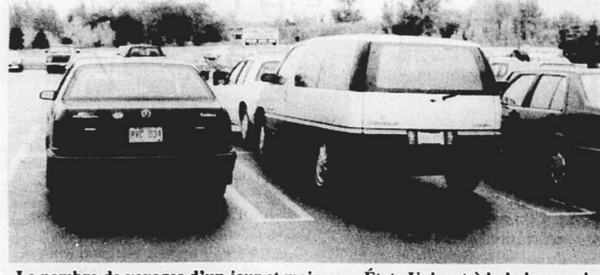
Le nombre de voyages d'un jour et moins aux États-Unis est à la baisse, mais les centres commerciaux se veulent tout de même très attirants.

texte de Cyril Alary de LA SOURCE Huntingdon - La grande région du Haut-Saint-Laurent, de par sa position géographique, a toujours été influencée par la proximité de la frontière américaine. Mais, depuis quelques mois, l'on remarque un certain refroidissement. Ce refroidissement se traduit par une baisse du magasinage fait par les gens de ce côté-ci de la frontière dans les nombreux établissements commerciaux de l'État de New York. En effet, selon certaines statistiques, le nombre de voyages d'un jour et moins aux États-Unis ne cesse de fléchir depuis le mois de février 1992. Est-ce une habitude que l'on est en train de perdre? C'est à se le demander. Mais, quelle est la véritable réponse à une telle question.