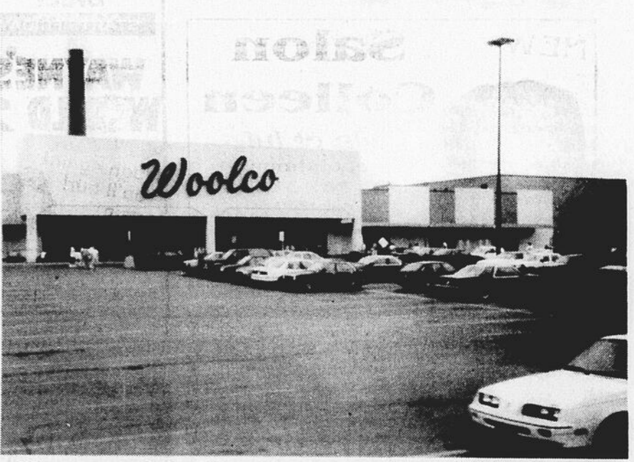
N'étant pas sur la liste d'acquisition par Wal-Mart, que réserve l'avenir au magasin Woolco de Valleyfield? Depuis la grève, rien n'est assuré à cet endroit.

Une telle décision de la part de Wal-Mart peut s'expliquer par le fait que s'installer à Valleyfield pourrait en quelque sorte nuire à ses magasins situés à Massena ou à Plattsburgh dans l'État de New York. Tout le monde sait que ces deux magasins tentent d'attirer une importante part de clientèle canadienne. Pour prouver ce point, il serait bon de se rappeler que les résidences de Valleyfield recevaient le pamphlet publicitaire de Wal-Mart jusqu'à la période des Fêtes. Il faut se rappeler que la compagnie Woolworth Corp. de New York avait décidé récemment de se lancer dans