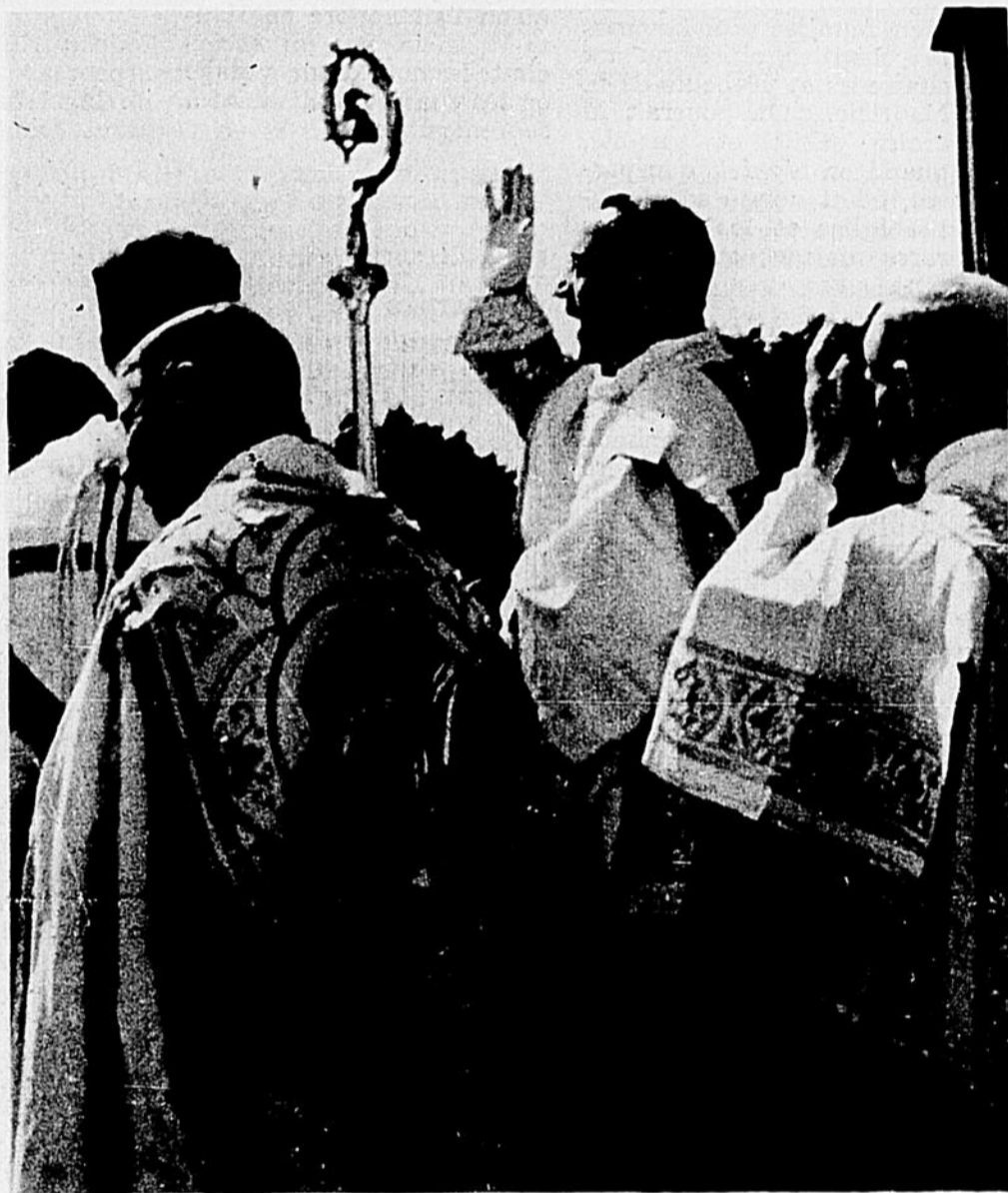
Au Congrès Eucharistique de Trois-Rivières (20-24 août 1941), dans un vaste temple en plein air auquel la cour du Séminaire servait de cadre, Mgr Antoniutti, avec la Majesté d'un pontife romain, donne sa bénédiction apostolique à la foule. Au premier plan, Mgr Charlier, alors supérieur du Séminaire, et l'abbé Henri Vallée.