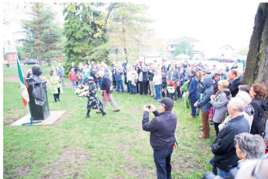
Près d'une centaine de personnes se sont donné rendez-vous à Verchères pour la Journée nationale des patriotes, le 20 mai, afin d'honorer un patriote contemporain, Bernard Landry.

de 775 hectares, ce qui contribuera à doubler la superficie de nature protégée sur les terres et dans les océans au pays. Au total, 27 îles sont visées par le projet du gouvernement et la superficie envisagée de terres protégées totalise près