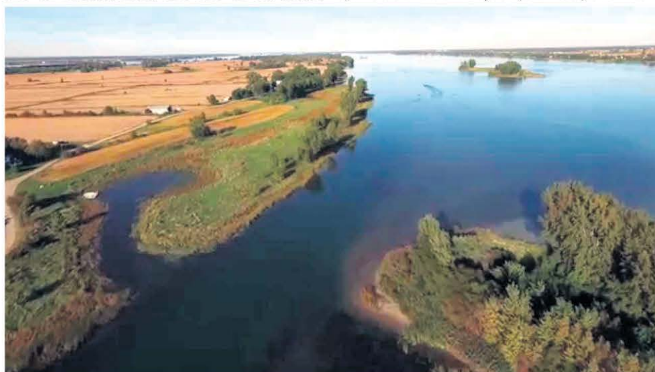
Le gouvernement du Canada a annoncé des projets d'importance pour la protection d'habitats naturels, dont la création potentielle de trois réserves nationales de faune sur le fleuve Saint-Laurent, parmi lesquelles on retrouve celle des îles de Varennes et de Verchères.

une jeune amablienne de 20 ans atteinte de trisomie partielle du chromosome 2, a été une grande réussite! Plus de 350 personnes étaient présentes et toutes les actions de