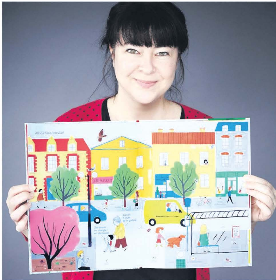
La maison d'édition Comme des géants, de Varennes, a remporté le prestigieux BOP - Prix Bologne pour le meilleur éditeur de littérature jeunesse dans le monde pour l'Amérique du Nord.

• La Société d'économie mixte de l'est de la couronne sud (SÉMECS) a remporté deux prix au mérite Ovation municipale 2019, le 11 mai, soit le prix Coup de cœur du jury, en raison du caractère exceptionnel de son projet, ainsi que le prix Votre coup de cœur, attribué par les délégués municipaux à leur projet favori. «À titre de représentants de nos communautés, nous sommes fiers d'avoir eu l'audace de mettre en place une société d'économie mixte, en plus de détenir une expertise unique dans le domaine du traite-