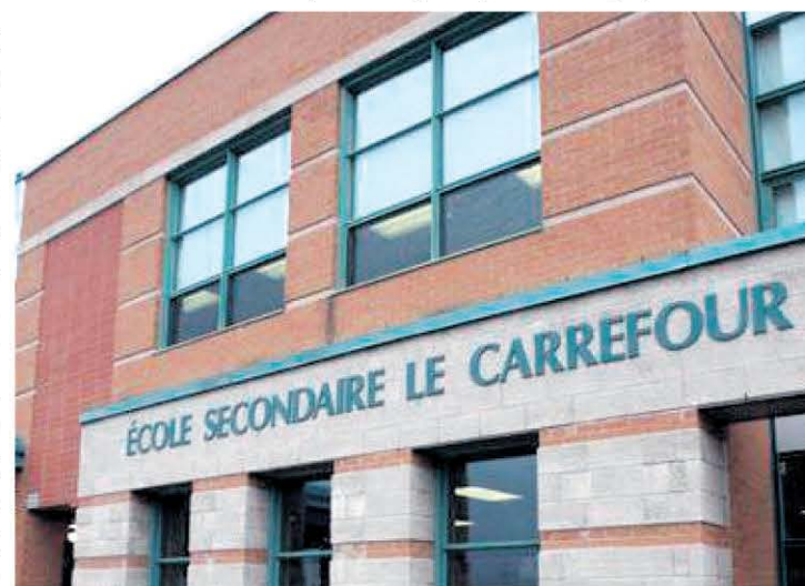
Québec a accordé 3 034 700 $ l'école secondaire le Carrefour à Varennes afin d'augmenter sa superficie pour accueillir 350 élèves de plus.

• La Ville de Sainte-Julie lance un projet pilote de mobilité partagée alors que des véhicules municipaux pourront être utilisés par les citoyens. Deux trottinettes électriques (GeeBee), deux vélos électriques, une voiture électrique Bolt et une camionnette à essence utilisés par les employés municipaux seront mis à la disposition des résidents moyennant certains frais. Ils pourront être loués en dehors des heures de travail. (Fin de la première partie) Et sur ce, joyeuses Fêtes!