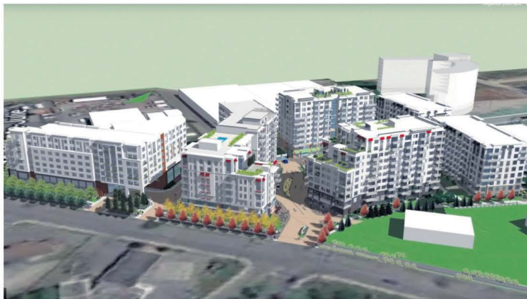
Le centre commercial Aux portes de la cité, situé près de la bibliothèque municipale de Sainte-Julie, sera démolé pour faire place à un complexe de six bâtiments construit au-dessus d'un stationnement souterrain de deux étages. Le projet initial présenté le 29 mai sera par la suite modifié.

• Une plantation de 1 500 arbres a été réalisée le long de la piste cyclopédestre du Grand-Coteau à Sainte-Julie en compagnie de personnalités publiques signataires du Pacte pour la Transition, de représentants