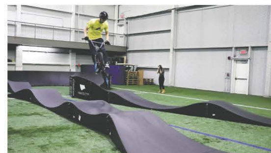
La première installation intérieure de Pumptrack modulaire nouvelle génération sera aménagée sur le site.