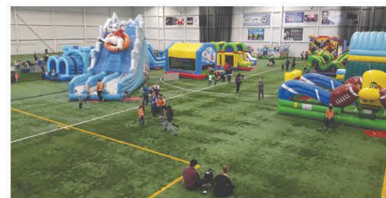
Petits et grands sont invités à participer à la plus grande activité familiale organisée dans la région au moment où le congé des fêtes tire à sa fin.