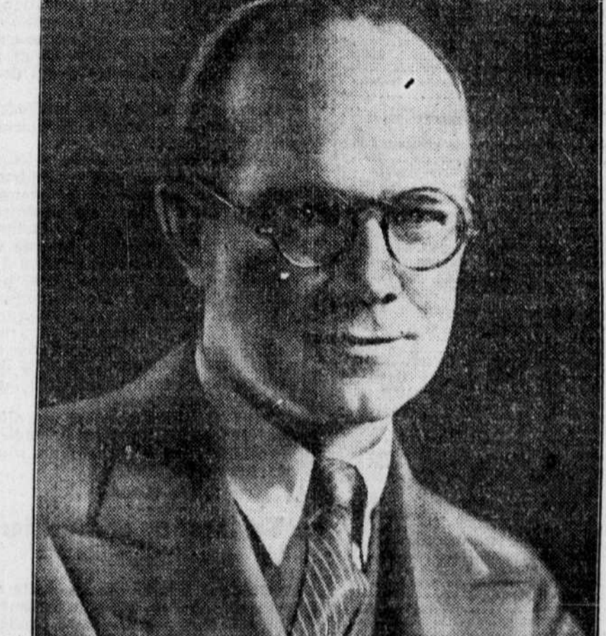
DEEMS TAYLOR, compositeur et chef d'orchestre, qui dirigera l'une de ses oeuvres au concert "General Motors", dimanche, 14 avril, à 8 heures, p.m., au poste WJZ.

On s'habille Les Mossi, qui cultivent le coton et s'habillent, appellent avec mépris les Guronsi, qui ne s'habillent pas: "bêtes de brousse".