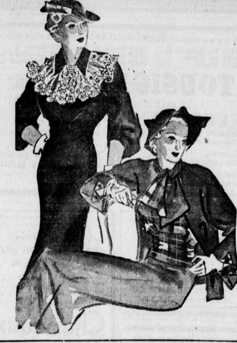
Assurés sur la valeur de la jeune génération.