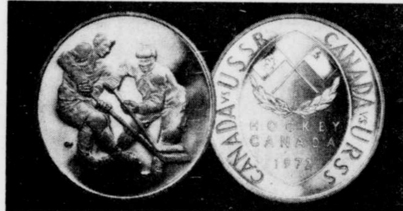
DIMENSION REELLE DES MEDAILLES: 2" DE DIAMETRE

M. Marcel Bégin 37, rue Dubord, Victoriaville Tél.: 752-5553 — Rés.: 752-2839